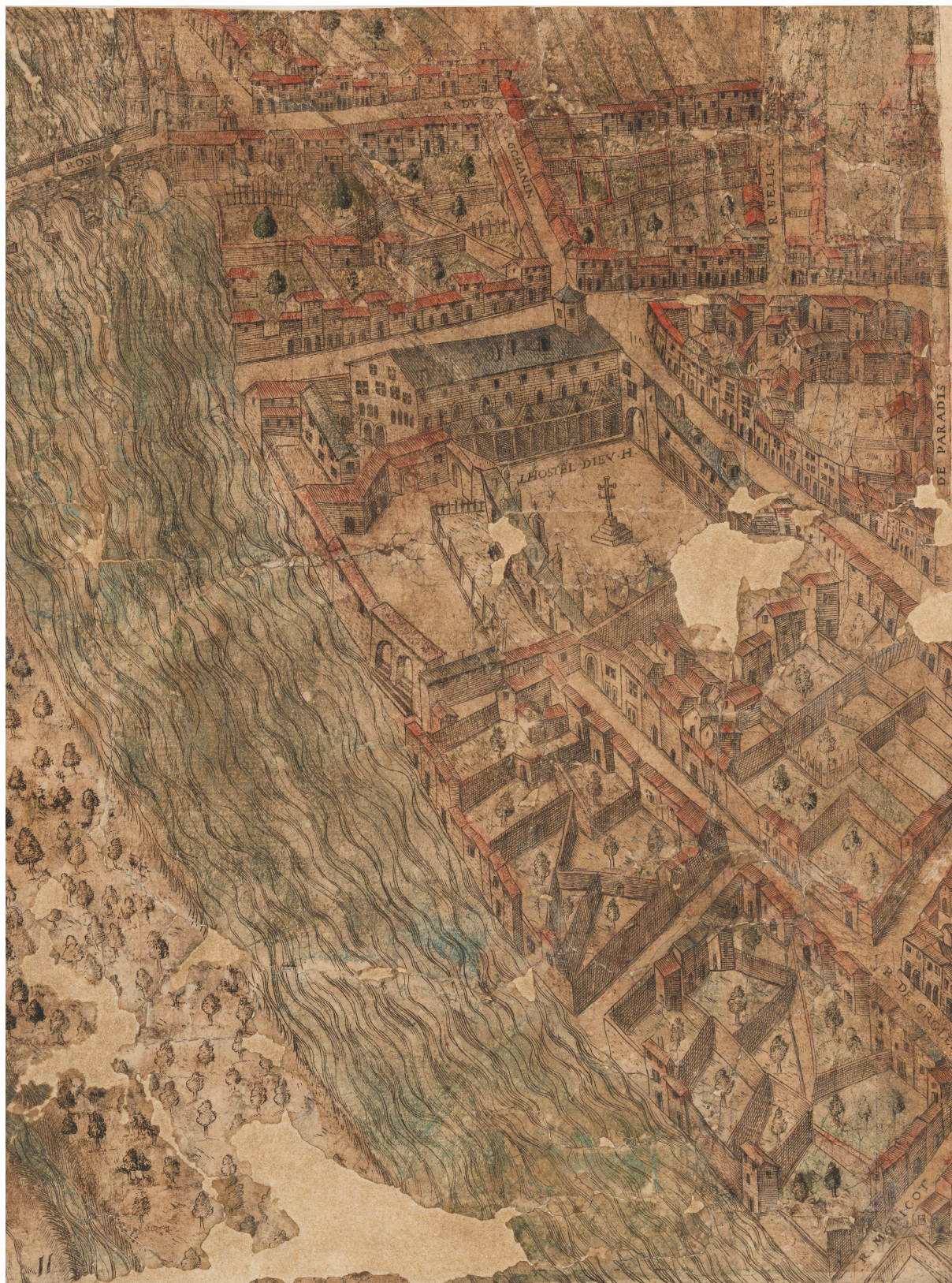
Fig. 1. L'Hôtel-Dieu au milieu du XVI e siècle. Extrait du plan scénographique de la Ville de Lyon (vers 1550).