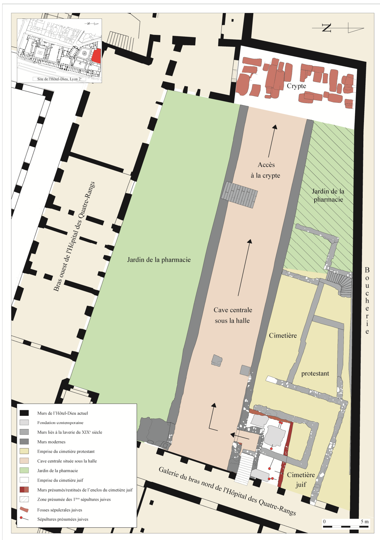
Fig. 5. Plan archéologique des lieux d'inhumations réservés aux juifs (1/200). DAO : Charlotte Ybard (SAVL)