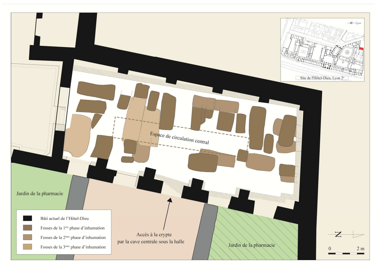
Fig. 6. Plan archéologique de la crypte des juifs (1/100). DAO : Charlotte Ybard (SAVL)

être identifiées comme des tombes de très jeunes enfants. L'analyse de la chronologie relative et de la répartition spatiale des différentes fosses permet en revanche de distinguer trois phases dans la gestion de cet espace funéraire ( fig. 6 ).