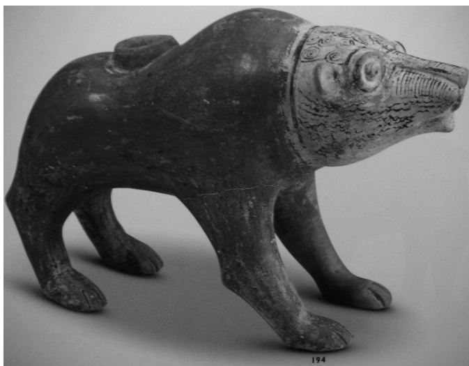
Fig. 1. Rhyton zoomorphe en forme d'ours, Kültepe, XIX e siècle av. J.-C. Musée des Civilisations Anatoliennes, Ankara (Özgüç 1998:248; 2003:200)