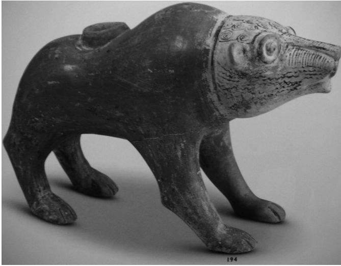
Fig. 1. Rhyton zoomorphe en forme d'ours, Kültepe, XIX e siècle av. J.-C. Musée des Civilisations Anatoliennes, Ankara (Özgüç 1998:248; 2003:200)