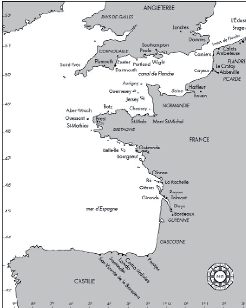
Figure 2. Les campagnes atlantiques de Pero Niño: inscription dans l'espace du récit de Gutierre Díaz de Games (1405-1406).

Saint-Mathieu (Saimago) et le raz de Sein, l'arrivée à Brest fait suite à la mention du passage du raz Blanchard (p. 273). Inexactitude imputable à l'auteur ou au copiste ? Gutierre Díaz commet des erreurs manifestes. Il parle des rochers du Casquet – situés entre les îles Anglo-normandes d'Aurigny et de Guernesey – à propos d'écueils à l'entrée du golfe d'Exeter (p. 295), et il prend Southampton pour Londres, sans que l'on sache s'il commet cette confusion à dessein ou non (p. 308). 17