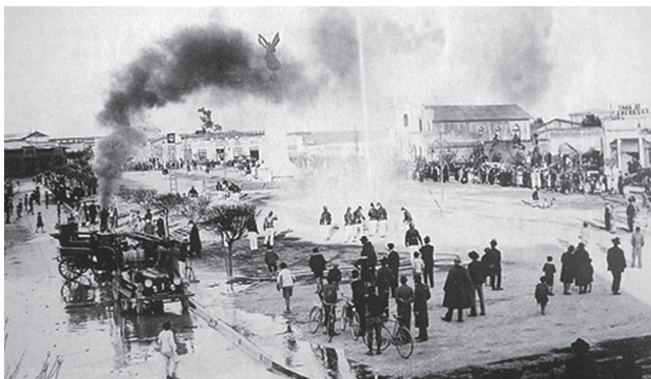
Estatua de La Victoria emplazada en Talca. Alrededor de 1930.

Existe una importante dispersión y carencia de documentación oficial que trate el tema del arribo y eventual destino de las estatuas y ornamentos para los paseos públicos de las ciudades chilenas, lo que imposibilita establecer un catastro y cronología de los hechos. Las fuentes más accesibles del proceso son los periódicos que informan de la instalación o traslado a alguna de las ciudades consideradas en el reparto de estos bienes. Al inicios del mes de diciembre de 1882, El Estandarte Católico informó del envío de dos estatuas de personajes de la mitología griega a Concepción, dos guerreros a Talca y la diosa Minerva a Chillán, además de la instalación de los bustos de Napoleón, César, Augusto y la estatua de Venus en el salón de la escultura de la Universidad de Chile 98 , a las que se sumaron dos días después cuatro grandes jarrones en el Parque Cousiño y dos en la plaza San Isidro 99 . No obstante, es posible suponer que ya existían otras estatuas trasladadas con antelación, pues las enviadas a las últimas ciudades estaban guardadas en la Intendencia de Santiago desde meses anteriores 100 . Al respecto, La Época destacaba que en los patios de la Intendencia se encontraban depositados 10 cajones con perros y leones de mármol "que se encontraban en la ciudad de los virreyes. Ayer solo se habían abierto dos cajones y podemos asegurar que son dignos objetos de arte. Aun no se sabe donde serán colocados" 101 .