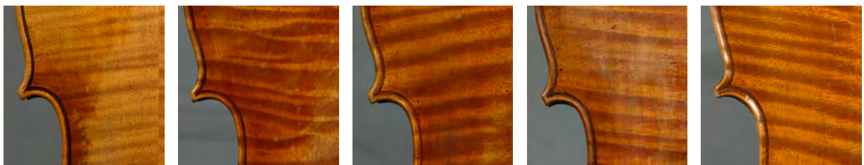
Les teintes des vernis peuvent varier du jaune-orangé au brun, en passant par un rouge profond. De gauche à droite et de haut en bas : détails des fonds du « Queux de Saint Hilaire » (modèle longuet), ca. 1692, du « Davidoff », 1708, du « Provigny », 1716, du « Sarasate », 1724 d'Antonio Stradivari, et du « Alard », 1742, de Giuseppe Guarneri 'del Gesù'. Tous ces instruments sont conservés au Musée de la musique de Paris.