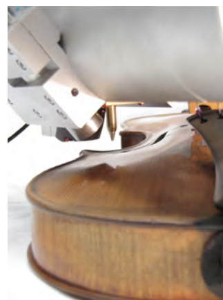
Analyse par spectrométrie de fluorescence X du vernis du « Sarasate ». L'analyse se fait sans contact, et ne modifie aucunement l'instrument.

Nous avons bien évidemment cherché à analyser le vernis là où il était d'origine, c'est-à-dire celui qui avait été appliqué par le luthier, ou sous son contrôle. En effet, un violon a pu subir au cours des siècles des usures, accidents, restaurations et revernissages. Jusqu'à présent, les