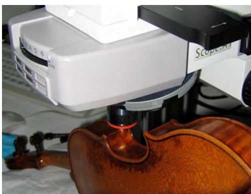
Observation au microscope in situ du vernis du « Queux de Saint Hilaire ».

Récemment, dans le cadre d'une recherche menée au laboratoire de recherche et de restauration du Musée de la musique de Paris, et en collaboration avec plusieurs autres laboratoires, nous avons mis en place une méthodologie expérimentale optimisée pour l'étude de vernis d'instruments de musique anciens, comprenant une quinzaine des techniques actuelles d'observation (microscopies, tomographie, etc.) et d'analyse (chromatographie, spectrométries, etc.). Nous avons en particulier privilégié l'utilisation de techniques in situ et non destructives (effectuées directement sur l'œuvre, sans prélèvement de matière).