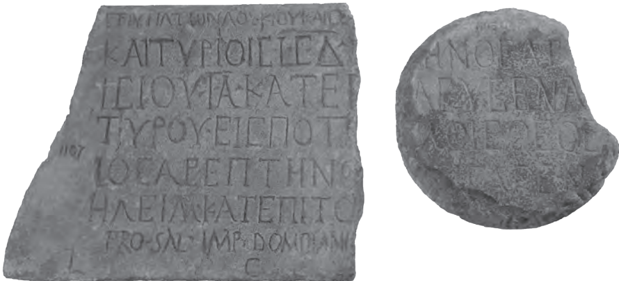
Fig. 1. Inscription commémorant l'arrivée du dieu de Sarepta à Pouzzoles.

Ἐπί ὑπάτων Λουκίου Καισε[ννίου καὶ Ποπλίου Καλουσίου] | καὶ Τυρίοις (ἔτους) σδ', [μ]ηνὸς Ἀρ[τεμ]ησίου ια', κατέ[π]λευσεν ἀ[πὸ] | 4 Τύρου εἰς Ποτι[ό]λοις θεὸς [ἄγ]γιος (Σ)αρεπτηνό[ς], ἤγαγεν [Αβδ]ηλειμ κατ' ἐπι(σ)το[λὴν τοῦ] ἰ[θεοῦ]. | Pro sal(ute) imp(eratoris) Domitiani [Aug(usti)]/ l(ocus) c(oncessus) d(ecreto) [d(ecurionum)].