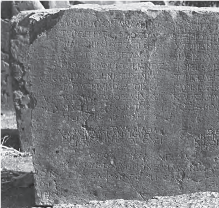
Fig. 2. Delphes : inscription honorifique du philosophe L. Calvinus Taurus.

Le gentilice de Taurus n'est attesté que par cette dédicace et par le passage fautif ou corrompu d'Aulu-Gelle, Nuits attiques , XVIII, 10, 3, où le philosophe tyrien est appelé à la fois par son nomen et par son cognomen . En se fondant sur la dédicace, on hésite entre Calvenus et Calvinus ( PIR 2 , C 339, et R. Flacelière, FD , III/4, p. 181). Certains éditeurs d'Aulu-Gelle préfèrent toutefois Calvisius , leçon donnée par la plupart des manuscrits des Nuits attiques (var. Calusius ) : ainsi R. Marache et Y. Julien (CUF, 1998, p. 103), qui ne semblent pas connaître l'inscription de Delphes ; contra P. K. Marshall (Oxford, 1968, p. 553), qui corrige le texte et qui retient soit Calvenus , soit Calvinus . Le texte d'Aulu-Gelle, en dépit de son caractère problématique, permet à mon avis de conserver Calvinus .