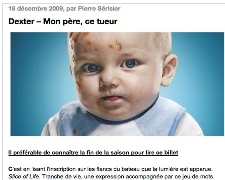
Fig. 6 - En-tête du billet sur le blog « Le Monde des séries », une fois ajouté l'avertissement. En plus du verbe de la phrase, le journaliste a tout de même oublié de mentionner le numéro de la saison en question.

« Alors oui, la convention est d'afficher "Attention spoilers" avant d'écrire un tel article, en effet. Ceci dit, faut être couillon pour lire l'article jusqu'au bout, alors qu'au 3ème paragraphe, on voit de suite que la fin va être révélée dans l'article... » (JP)