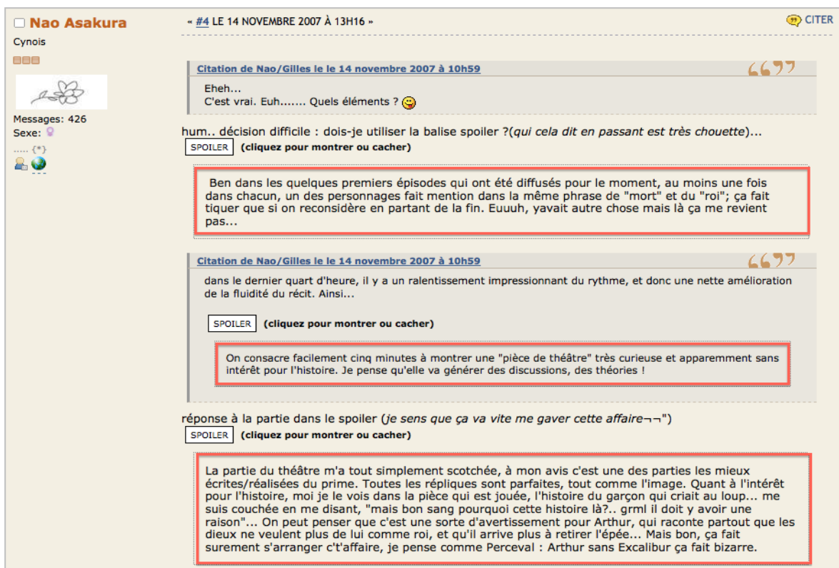
Fig. 5 - Le même message une fois les spoilers affichés ; l'aspect confus du dialogue, fait de citations et de balises actives, fini par être pointé par un des locuteurs : « je sens que ça va vite me gaver cette affaire »