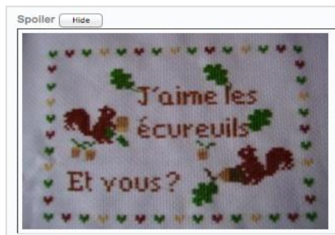
Fig. 3 - Balise « spoiler » détournée de sa fonction

Certains internautes s'en amusent et détournent le dispositif (figure 3). L'information décisive dissimulée s'avère être une phrase ou une image à visée humoristique :