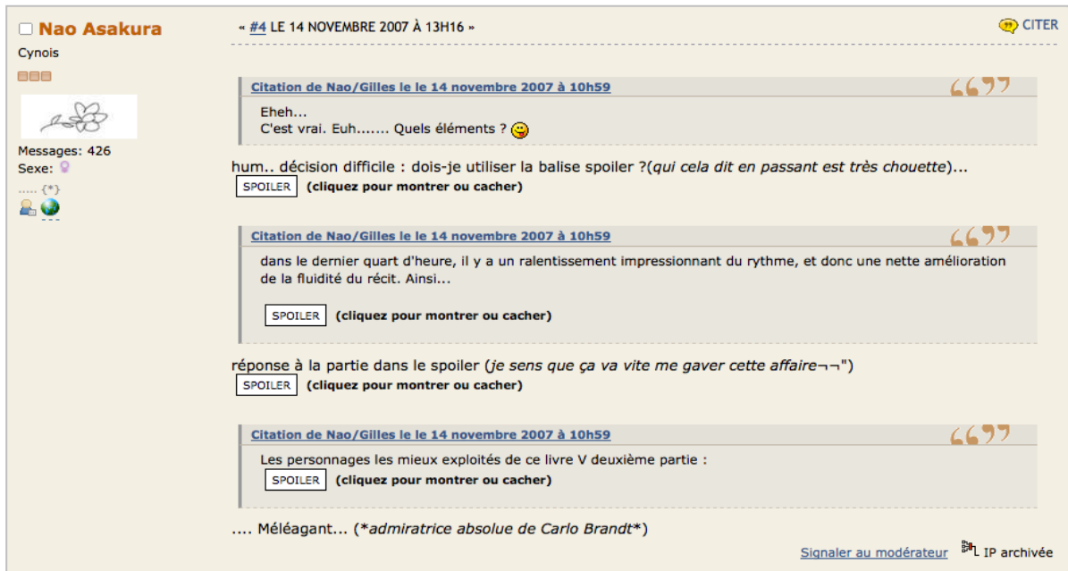
Fig. 4 - Message tiré d'une conversation sur un forum dédié à Kaamelott 6