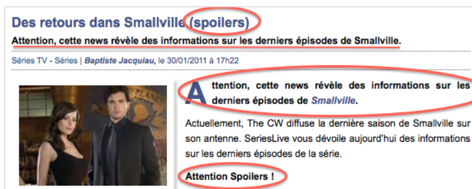
Fig. 1 - En-tête d'un article publié par SeriesLive concernant des épisodes de Smallville en cours de diffusion aux États-Unis

Les sites eux-mêmes, par l'intermédiaire de leur(s) administrateur(s), utilisent largement le système des balises et avertissements. Au même titre que dans les forums, celles-ci doivent être accolées à tout élément (article ou paragraphe, vidéo) traitant d'épisodes inédits à la télévision française (figure 1). De ce point de vue, le site PerDUSA consacré exclusivement aux séries anglo-américaines fait exception à la règle. Pourtant administré par un collectif de sériphiles français, y est considéré comme spoiler « toute information relevant d'un épisode qui n'a pas encore été diffusé aux États-Unis » 5 .