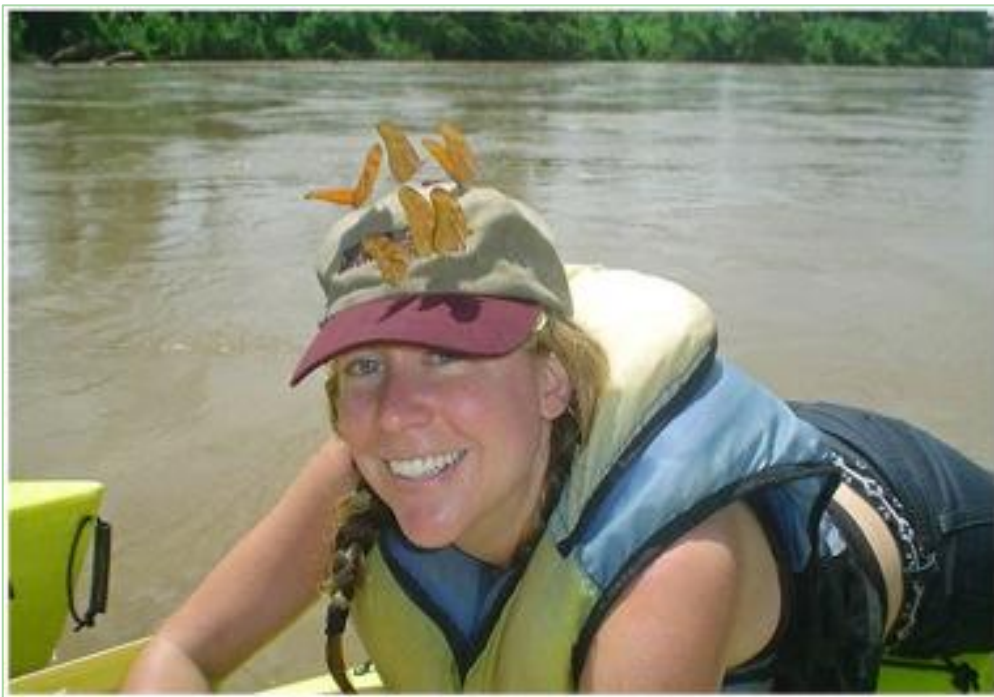
FIGURE 1. Ecotouristes et papillons