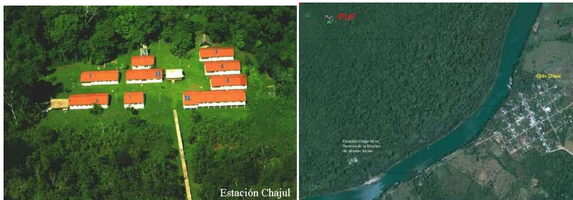
Figure 3 : L'organisation spatiale de la station et du village de Chajul