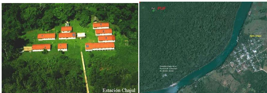
Figure 3 : L'organisation spatiale de la station et du village de Chajul