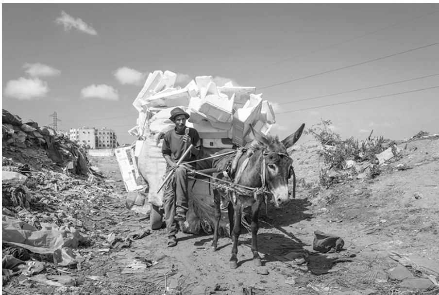
Figure 1 – Un récupérateur du quartier des grossistes de Lahraouine avec son chargement de polystyrène revendu comme isolant dans le bâtiment. Nous précisons que les photos de cet article ont été prises avec l'accord des intéressés. © Pascal Garret 6 , Casablanca, 2016

Or, notre recherche menée auprès de récupérateurs de déchets à Rabat-Salé et Casablanca montre que, s'ils sont conscients des jugements portés sur eux, ils élaborent cependant un contre-discours relativisant ces catégories et stigmatisations à leur encontre. Ce discours de légitimation de leur place en ville et de leur rôle en faveur de la société est à leurs yeux d'autant plus nécessaire que l'indésirabilité à leur égard se matérialise aussi par de nombreux obstacles réduisant leurs activités de collecte de la ressource qu'est le déchet et menaçant leur gagne-pain. Liée aux politiques publiques, cette régulation de l'indésirabilité oscille entre élimination, contrôle, formalisation et inclusion de ces « travailleurs des déchets » (Corteel, Le Lay, 2011).