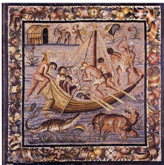
Fig. 1. Mosaïque représentant le naufrage d'un bateau sur le Nil, provenant de Tivoli (?). Cardiff, National Museum of Wales n° 32.93 (fin du 1 er siècle av. J.-C.) [d'après WHITEHOUSE 1985, pl. 28, fig. 1]

Comme l'auteur le souligne, l'essentiel des études sur la navigation s'est jusqu'à présent concentré sur les types de bateaux et leurs caractéristiques techniques. Ce constat vaut aussi bien pour l'époque médiévale que pour l'époque antique – peu d'études ont été consacrées aux conditions de déplacement sur le fleuve pour la période pharaonique 6 ; il y a donc urgence à reconsidérer un ensemble de données désormais élargi par les apports de l'archéologie et de la géomorphologie, au prisme de problématiques nouvelles et d'une méthodologie plus stricte.