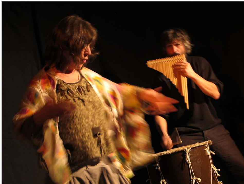
Figure 3 : Le spectacle Gargantua et Cie, régulièrement soutenu par le Pnc, met en scène les légendes topographiques de la Lozère, ici à St-Germain de Calberte, en 2015