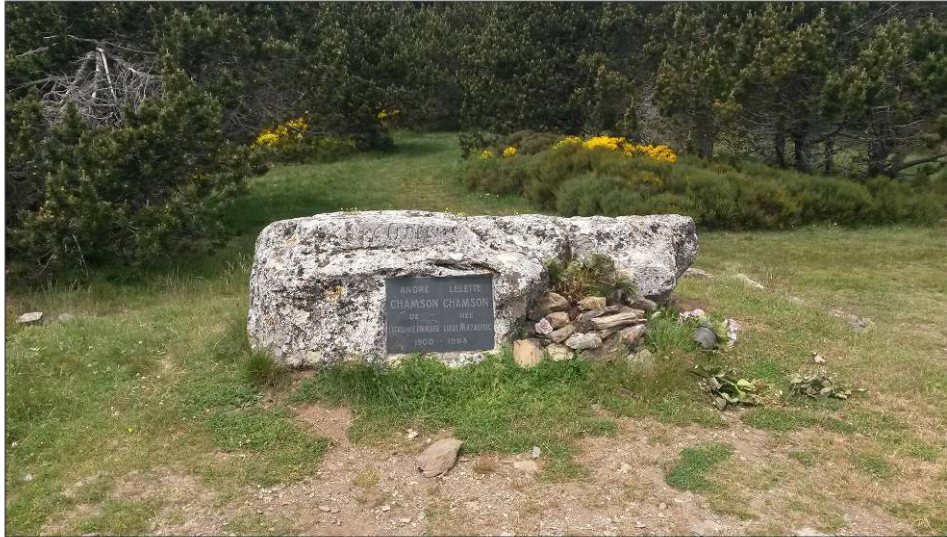
Figure 4 : L'écrivain gardien de l'esprit des lieux. Tombe d'André Chamson, au Serre de la Luzette (1290 m), face au Mont Aigoual