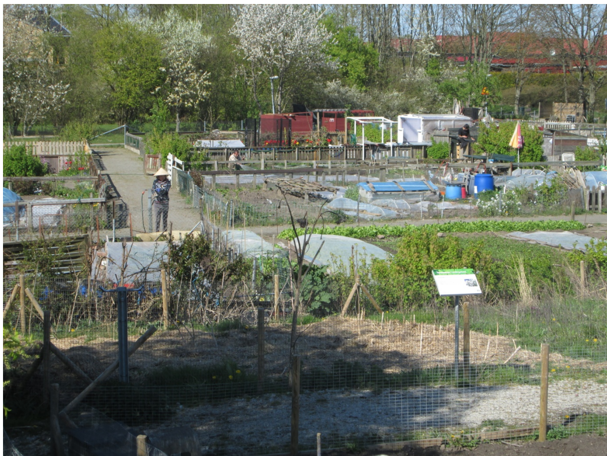
Parcelles du lot de jardins municipaux ( odlingslotter ) de Vårsången, quartier sud de la ville de Malmö (Hochedez, 2016)

Une partie de ce que mangent les villes est désormais produite en leur sein. En effet, l'agriculture fait depuis une quinzaine d'année son grand retour dans les villes du Nord, sous des formes très diverses. Une définition large de l'agriculture urbaine, entendue ici comme toute activité de production végétale à renouvellement rapide, professionnelle ou amatrice, destinée à une consommation ou un usage urbains, et pratiquée sur des terrains localisés dans la ville ou à sa périphérie (Moustier et M'Baye, 1999 ; Scheromm et al. , 2014), rend compte de son renouveau, de la diversité de ses acteurs et d'un continuum de formes, allant des jardins collectifs aux exploitations marchandes classiques (Nahmias et Le Caro, 2012).