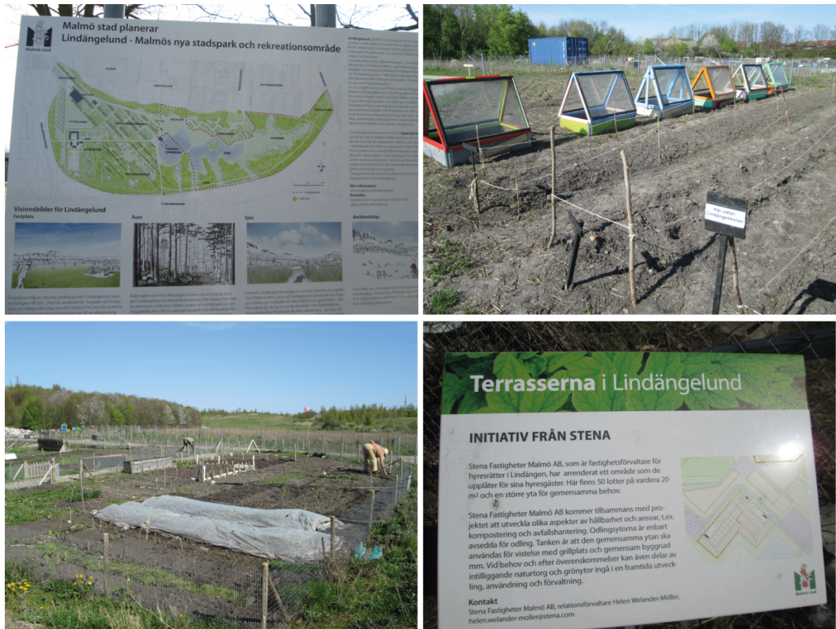
8. Les nouvelles parcelles de jardinage prévues dans le projet d'aménagement de Lindängelund au Sud de la ville ouvrent les odlingslotter de Vårsången à de nouveaux usagers potentiellement en concurrence avec les communautés immigrées (Hochedez, 2016)

On peut émettre l'hypothèse que les populations immigrées de cultivateurs vont être peu à peu évincées des espaces de l'agriculture urbaine au gré des projets d'aménagement. Au nom de la durabilité, ces populations se trouvent exclues de ces espaces, pas volontairement, mais parce que les odlingslotter dans leur nouvelle version ne répondent plus aux critères de cultures (grandes parcelles, accessibilité, etc.) recherchés par les communautés immigrées traditionnellement présentes dans ces espaces.