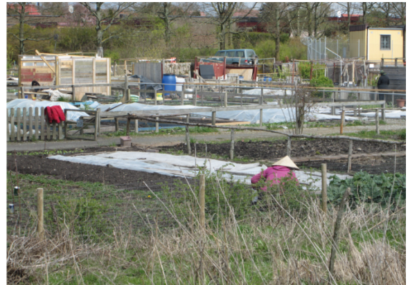
2. Différentes formes de serres traduisant des cultures intensives sur les jardins d'Almqvist (photo de gauche), où ces constructions sont exceptionnellement autorisées, et à Vårsängen (photo de droite), où ces constructions sont normalement interdites (Hochedez, 2016)

En deuxième lieu, d'autres marqueurs paysagers traduisent des pratiques intensives dans la gestion de l'eau et des cultures. La présence de tonneaux de récupération des eaux de pluie, voire de tuyaux d'arrosage avec mitigeur, indique que l'eau est stockée pour pouvoir commencer à cultiver avant la mise en service des robinets par la mairie (figure 3). Et, effectivement, fin avril, la terre est déjà très travaillée, et les premiers légumes sont sortis de terre, ce qui contraste avec d'autres parcelles peu entretenues à cette période de l'année. Ces signes visibles de cultures intensives et précoces s'expliquent aussi par la possibilité de faire du primeur (certes plus tardif en Suède du fait des conditions climatiques), et donc de vendre sa production plus cher.