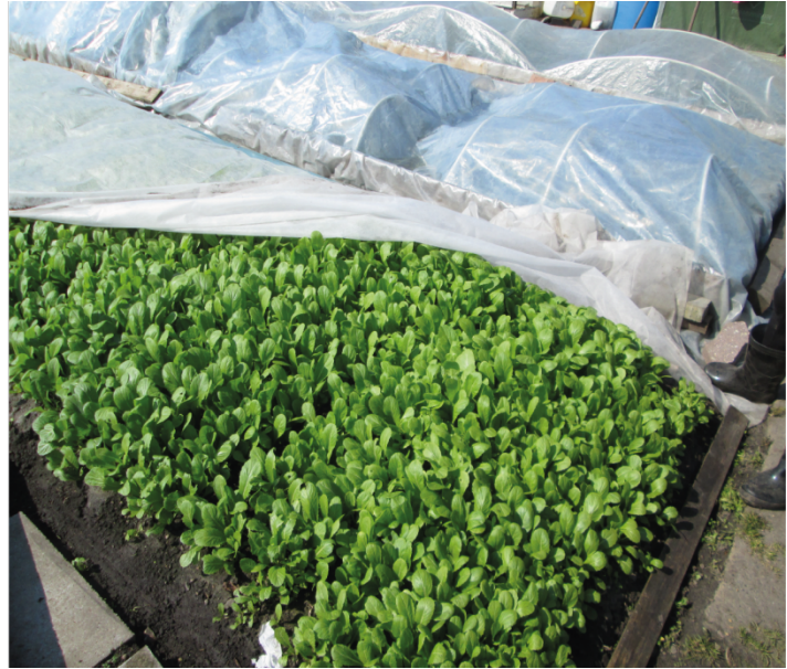
4. Les parcelles asiatiques se distinguent par les types de cultures pratiquées, ici du cresson de fontaine (à gauche) et du brocoli chinois (à droite) (Hochedez, 2016)

La différence dans les pratiques culturelles rend visible une différence culturelle. Les jardins sont une manière de préserver à la fois des variétés traditionnelles et des pratiques alimentaires culturelles en situation de migration. Nos observations rejoignent celles d'Airriess et Clawson (1994) sur les jardins vietnamiens en Louisiane ou de Wekerle (2002) et Baker (2004) sur les jardins de Toronto : les minorités façonnent des « cultural landscapes » (Baker, 2004) reflétant la diversité culturelle des communautés et les rendant visibles dans la ville. Ils construisent aussi des « espaces autotopographiques » (Mares et Pena, 2011) au sens où les espaces de jardin contribuent à créer un sentiment d'être chez soi. Ils permettent ainsi de préserver l'identité alimentaire des immigrés (Gerodetti et Foster, 2016) tout en assurant une continuité alimentaire dans le pays d'accueil.