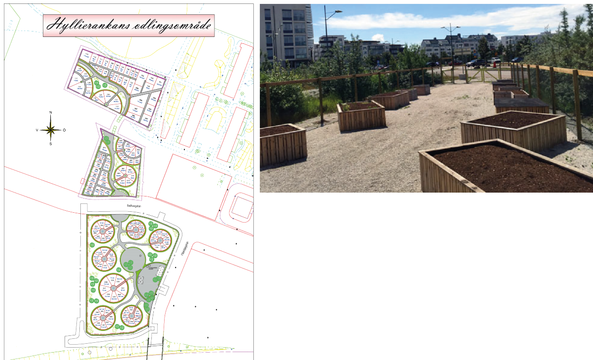
7. Les nouveaux odlingslotter de Hyllie et de Västra Hamnen. Le plan de Hyllierankan (à gauche) montre de très petites parcelles. Dans l'écoquartier de Västra Hamnen (à droite), ce sont des parcelles sous forme de boîtes qui ont été privilégiées (Malmö Stad, 2016)

une fréquentation des parcelles de jardin par de nouvelles populations décrites par les services municipaux comme des « hipsters » pour qui cultiver soi-même est une « mode », des jeunes, des familles motivées par le désir d'apprendre à leurs enfants à jardiner et par la possibilité de pratiquer une activité en plein-air. L'absence d'enquête auprès de ces nouveaux usagers ne permet pas de démontrer le rajeunissement des jardiniers ni l'évolution des motivations pointées par la municipalité. Mais ces nouvelles tendances illustrent la multiplicité d'usages et de visions des jardins, sans que la municipalité n'établisse de préférence ou de hiérarchie entre les usages. Quoiqu'il en soit, ces nouvelles formes des odlingslotter ne correspondent plus aux usages ni aux pratiques des communautés immigrées (parcelles trop petites et mal localisées par rapport aux quartiers d'habitation).