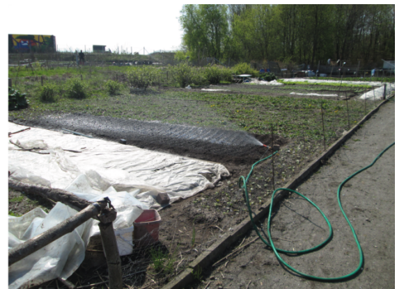
3. Les techniques d'irrigation (tonneau de récupération des eaux de pluie, tuyaux d'arrosage avec mitigeur) sur les parcelles asiatiques d'Almqvist et Vårsängen permettent la mise en culture précoce des parcelles, dont certaines (photo de droite) ont déjà bien poussé fin avril (Hochedez, 2016)