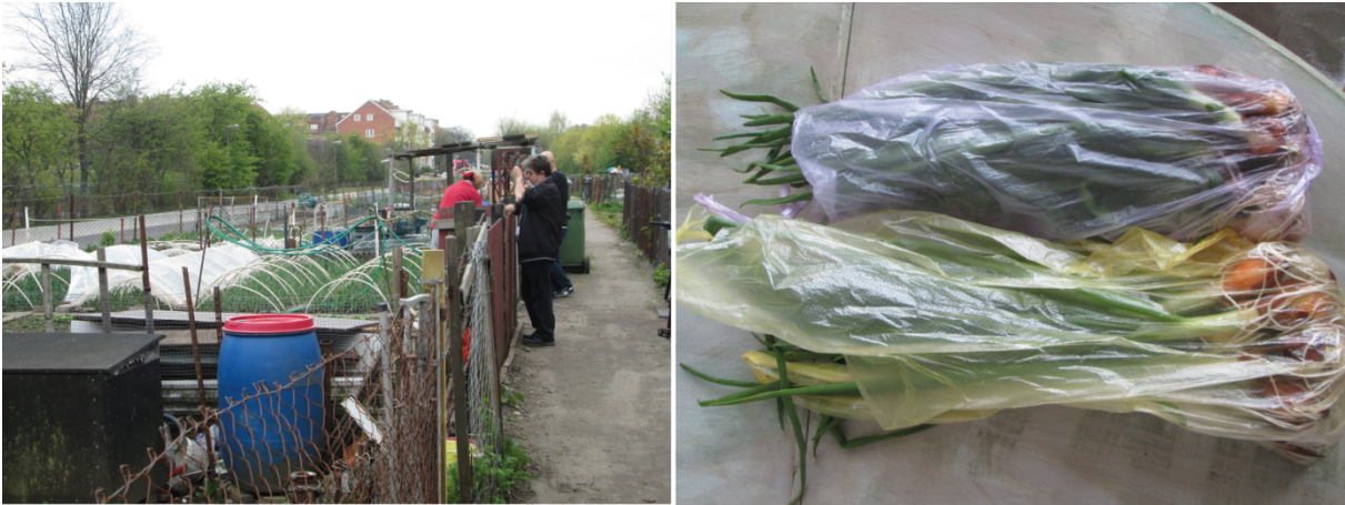
6. Vente de légumes directement sur la parcelle par des membres de la communauté bosniaque, sur le jardin de Navet. La présence de sachets plastiques pour emballer la marchandise traduit une organisation bien rôdée (Hochedez, 2016)

Les cultivateurs, majoritairement des personnes âgées, sont des paysans urbains qui sont aussi et surtout des commerçants (Peraldi, 2002) ; et c'est en cela que ces migrants sont vecteurs de changements dans les paysages alimentaires urbains.