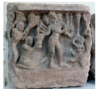
Figure 12. — Bas-relief figurant Rāvaṇa, X e siècle, Quảng Nam (?), Vietnam. Grès, env. 30 × 40 cm. Musée de la sculpture came de Đà Nẵng, n° d'inv. 45.1.