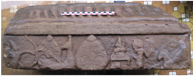
Figure 6. — Relief V. La chasse de la biche dorée – Rāvaṇa se rend à l'ermitage, x e -xi e siècle, Khương Mỹ (Quảng Nam, Vietnam). Grès, env. 71 × 25 cm. Réserve du site.