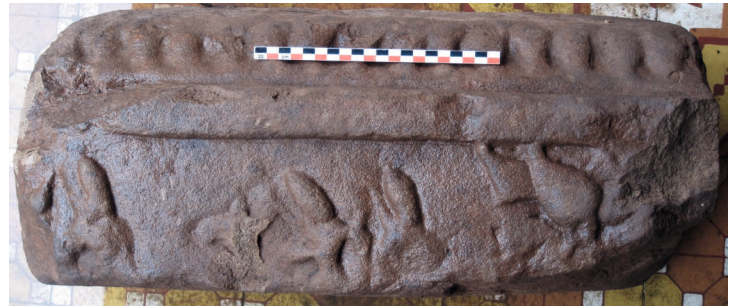
Figure 3. — Relief II. Rencontre avec Jaṭāyus, x e -xi e siècle, Khương Mỹ (Quảng Nam, Vietnam). Grès, env. 55 × 22 cm. Réserve du site.

Une distinction forte est attestée à la fois dans le relief et dans l'épopée écrite entre le ṛṣi, figuré au centre du groupe de gauche, et ses disciples. L'un d'entre eux joue d'ailleurs le rôle d'intermédiaire entre les héros et le saint homme en annonçant leur arrivée et en les introduisant auprès de son maître 30 . Sa position d'intermédiaire serait astucieusement reflétée par la gestuelle de l'ascète se tenant au plus près du groupe assis. Ce dernier incline la tête dans leur direction, tandis que les deux autres religieux sont encore en conversation. Les rapports de pouvoir matérialisés dans cette composition sont en effet complexes et soulignent l'interdépendance canonique entre brahmanes et kṣatriya . Ainsi, le respect témoigné par les deux groupes est réciproque et le service que Rāma doit aux ascètes est clairement rappelé dans le texte. Le rappel de son statut va de pair avec les devoirs qui lui incombent en tant que « souverain universel ».