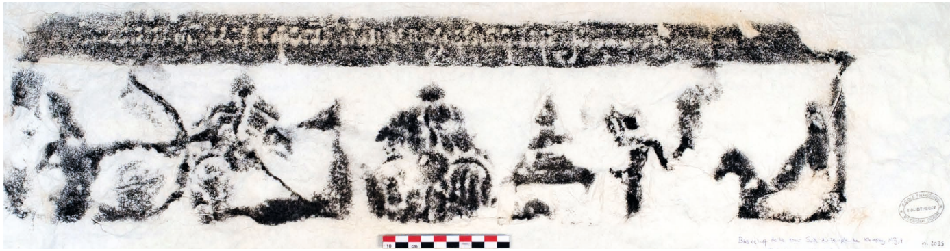
Figure 26. — Estampage EFEO n. 2095, légende du relief n° V (fig. 6).