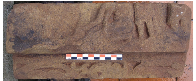
Figure 22. — Scène non identifiée, x e -xi e siècle, Khương Mỹ (Quảng Nam, Vietnam). Grès, env. 35 × 20 cm. Réserve du site. (2011).