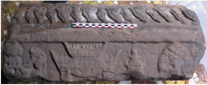
Figure 13. — Relief VII. Rāvaṇa supplie Sītā de l'épouser à leur arrivée à Laṅkā, x e -xi e siècle, Khương Mỹ (Quảng Nam, Vietnam). Grès, env. 62 × 24 cm. Réserve du site.