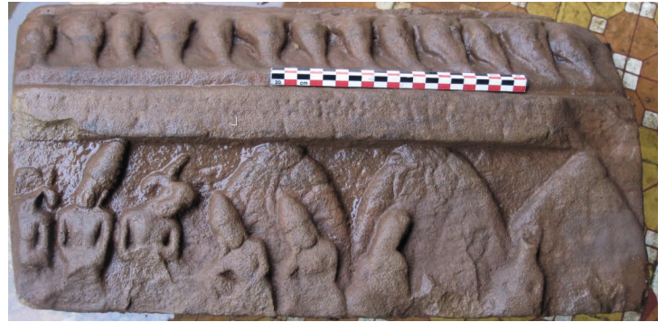
Figure 2. — Relief I. Rencontre forestière, entretien avec les ascètes de la forêt Daṇḍaka, x e -xi e siècle, Khương Mỹ (Quảng Nam, Vietnam). Grès, env. 48 × 24 cm. Réserve du site.