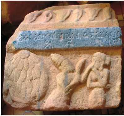
Figure 4. — Relief III. Lakṣmaṇa et Śūrpaṅakhā, x e -xi e siècle, Khương Mỹ (Quảng Nam, Vietnam). Grès, env. 25 × 22 cm. Réserve du site.