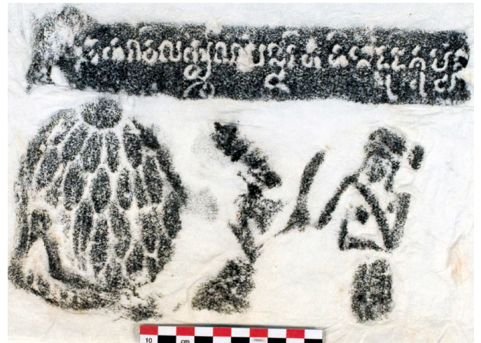
Figure 25. — Estampage EFE0 n. 2093, légende du relief n° III (fig. 4).

Arrêtons-nous maintenant sur le contenu des inscriptions telles qu'elles ont pu être lues à partir des estampages. Nous aurions voulu interroger ici le caractère complémentaire des deux média utilisés à Khương Mỹ, en tentant de mettre en lumière le degré de proximité entre le discours épigraphique et le discours porté par la narration visuelle. Mais le fait que seuls quatre des estampages pris sur des reliefs du Rāmāyaṇa ont livré des séquences lisibles contraint sensiblement notre démarche. Nous en livrons ici une édition ainsi que, lorsque cela sera possible, des éléments de traduction 66 :