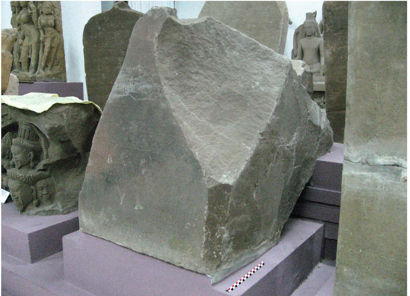
Figure 28. — Fragment de pilier portant l'inscription C. 63. Grès, 69 × 57 × 93 cm. Musée d'Histoire nationale, Hanoi, n° d'inv. LSb 21161.