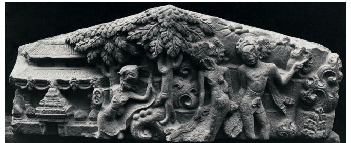
Figure 10. — Relief figurant la Malédiction de Tilottamā, fin du X e siècle, Candi Jolotundo (Java Est, Indonésie). Calcaire, env. 38 × 70 cm. Museum Nasional Republik Indonesia, Jakarta, n° d'inv. 5841. Cliché Leiden University Library Special Collections, OD-7030.