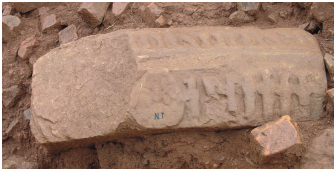
Figure 18. — Scène non identifiée, X e -XI e siècle, Khương Mỹ (Quảng Nam, Vietnam). Grès, dimensions inconnues. Cliché Trần Kỳ Phương (2007).