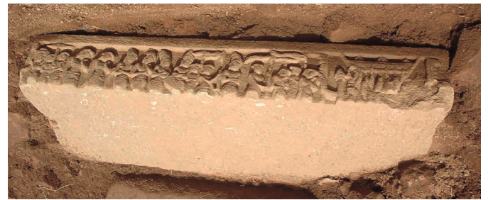
Figure 21. — Scène non identifiée, x e -xi e siècle, Khương Mỹ (Quảng Nam, Vietnam). Grès, dimensions inconnues.