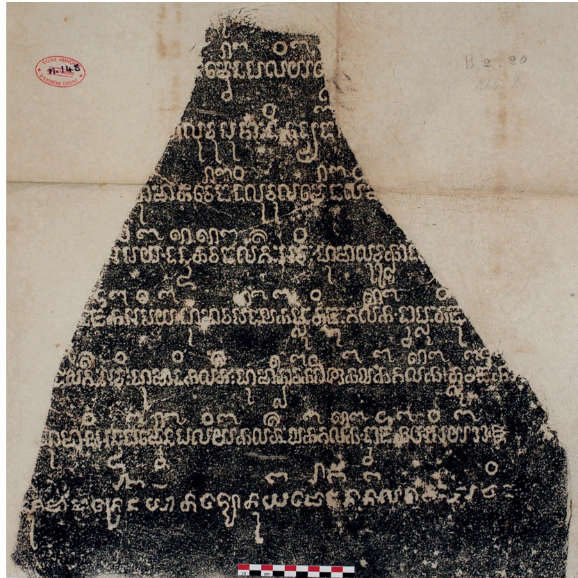
Figure 29. — Estampage EFE0 n. 148 pour C. 63, face antérieure.