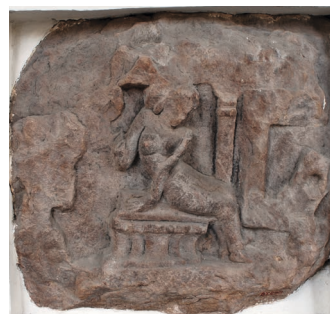
Figure 11. — Fragment d'une scène du Rāmāyaṇa : Sītā (?), X e siècle, Trà Kiệu (?) (Quảng Nam, Vietnam). Grès, hauteur env. 54 cm. Musée de la sculpture came de Đà Nẵng, n° d'inv. 45.4. (2007).