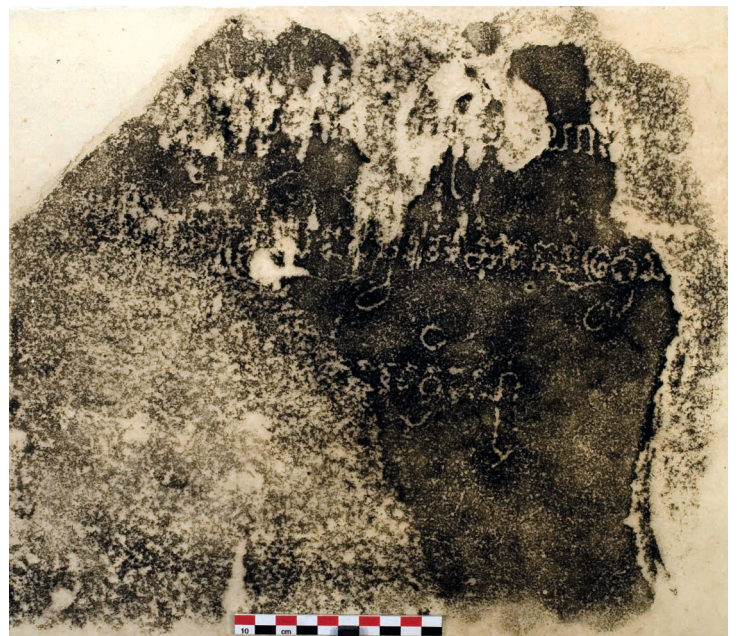
Figure 30. — Estampage EFE0 n. 1848 pour C. 63, face latérale.