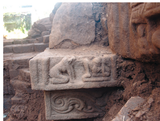
Figure 23. — Scène non identifiée, x e -xi e siècle, Khương Mỹ (Quảng Nam, Vietnam). Grès, dimensions inconnues.