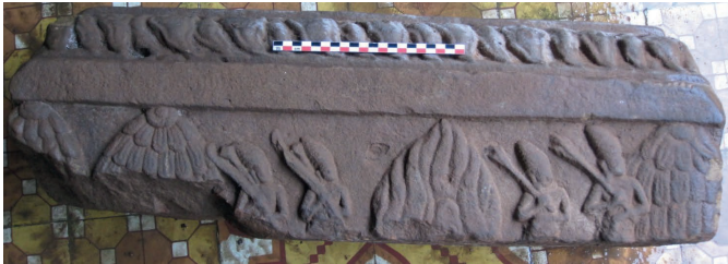
Figure 15. — Relief IX. Scène de bûcher : Rāma et Lakṣmaṇa armés s'avancent, x e -xi e siècle, Khương Mỹ (Quảng Nam, Vietnam). Grès, env. 74 × 23 cm. Réserve du site. Cliché Arlo Griffiths (2011).

Poursuivant notre lecture parallèle du Rāmāyaṇa et des reliefs, la scène que nous pensons s'inscrire à la suite directe de l'enlèvement est celle qui est dépeinte sur le relief n° VII (fig. 13). Ici, l'unité de lieu est différente : nous nous trouvons dans un environnement palatial. En effet, dans le chapitre 55 du livre III, Rāvaṇa et Sītā sont parvenus à Laṅkā. Ici, comme sur le premier relief (fig. 2) où les protagonistes pénétraient dans la forêt, l'environnement nouvellement découvert est livré à la contemplation. C'est sous la forme d'une imposante et complexe architecture que la cité de Rāvaṇa apparaît aux yeux du spectateur. Dans le texte, Vālmiki s'adonne à une longue description d'un « entrelacs d'édifices et de palais [...] qui regorgeaient d'objets précieux » 48 . Mais ces descriptions des splendeurs de Laṅkā cèdent la place au dialogue entre Rāvaṇa et Sītā, au cours duquel celui-ci demande à la princesse de le prendre pour époux. Celui-ci est fidèlement retranscrit en images, la tentative de séduction du rākṣasa étant évoquée par la promiscuité entre les deux personnages, le geste de la main droite de Rāvaṇa s'approchant de sa proie tandis que les pleurs de Sītā, « navrée