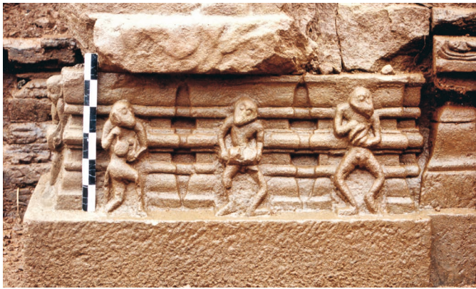
Figure 17. — Singes musiciens, X e -XI e siècle, Khương Mỹ (Quảng Nam, Vietnam). Grès, 26 × 69 cm. Cliché Nguyễn Hồng Kiên (2001).