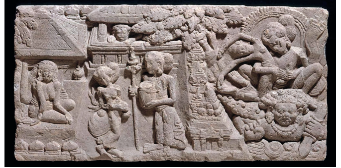
Figure 8. — Bas-relief figurant l'Enlèvement de Sītā, XI e siècle, provenance exacte inconnue (Java Est, Indonésie). Tuf volcanique, 39,3 × 77,4 cm. Museum of Fine Arts, Boston, n° d'inv. 67.1005.