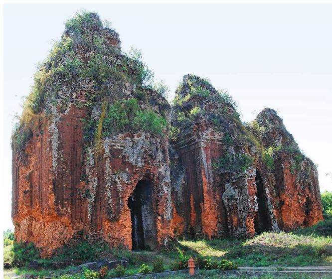
Figure 1. — Vue des trois tours de Khương Mỹ (Quảng Nam, Vietnam), ca. x e siècle.

Des sculptures de Khương Mỹ se trouvaient peut-être parmi la cinquantaine de pièces ayant rejoint, en décembre 1891 et janvier 1892, le jardin de sculptures de Tourane sur les ordres de Charles