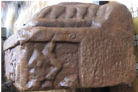
Figure 7. — Relief VI. L'enlèvement de Sītā par Rāvaṇa, x e -xi e siècle, Khương Mỹ (Quảng Nam, Vietnam). Grès, env. 38 × 22 cm. Réserve du site. Cliché Arlo Griffiths (2011).

et, vraisemblablement, un arc et une flèche, apparaît en train de s'éloigner. Ce relief met donc en scène plusieurs actions successives, plusieurs unités de temps du récit réunies en une image. Cependant, la narration visuelle omet un passage relativement important du texte, celui où Lakṣmaṇa tente de mettre Rāma en garde contre l'illusion qu'incarne le démon Mārīca. Ainsi, ce relief s'avère riche d'enseignements quant au processus de sélection qui a guidé les sculpteurs dans l'élaboration du programme iconographique. Il apparaît que seules certaines scènes, ou certaines thématiques servant le discours qui sous-tend l'ensemble de l'iconographie du temple, ont été conservées.