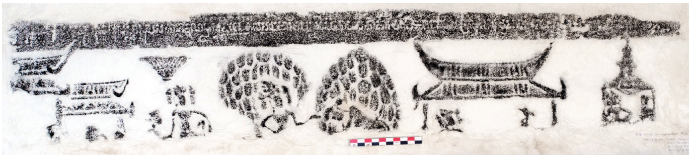
Figure 27. — Estampage EFEO n. 2092, légende du relief n° X (fig. 16).

Relief n° IV (fig. 6). L'estampage EFEO n. 2095 (fig. 26) a livré la séquence suivante :