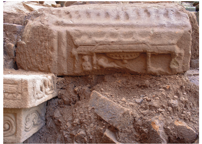
Figure 20. — Scène non identifiée, x e -xi e siècle, Khương Mỹ (Quảng Nam, Vietnam). Grès, dimensions inconnues.

Le dernier groupe de deux reliefs ( fig. 22, 23 ) a pour caractéristique commune une cassure nette en partie supérieure, nous privant ainsi de la moitié supérieure de la composition. En outre, ils conservent au-dessous du bord inférieur de leur cadre un fragment du registre inférieur, registre a priori décoratif où se déploient des rinceaux. Un de ces fragments ( fig. 22 ) compte trois personnages, dont deux sont debout et le troisième assis sur ses talons. Ils sont tournés vers la gauche. Le relief y est particulièrement écrasé, et les contours des formes nous paraissent plus graphiques que pour les compositions du cycle épique. Cette différence d'aspect ne caractérise pas la seconde pièce de ce sous-ensemble, une scène sculptée sur une face d'un bloc d'angle ( fig. 23 , l'angle visible sur la fig. 20 à gauche). Celle-ci figure une conversation entre un personnage féminin agenouillé, les deux mains posées sur le sol, et un personnage vraisemblablement masculin assis face à elle. Si l'on en juge d'après la vue d'ensemble du registre sculpté ( fig. 20 ), l'autre