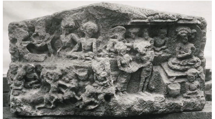
Figure 9. — Relief figurant le Mariage de Pāṇḍu et Kuntī (?), fin du X e siècle, Candi Jolotundo (Java Est, Indonésie). Calcaire, env. 50 × 70 cm. Parmi les entassements de blocs de pierre sur le site (moitié gauche), situation actuelle inconnue (moitié droite). Cliché Leiden University Library Special Collections, OD-6558.