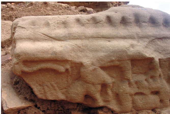
Figure 19. — Scène non identifiée, X e -XI e siècle, Khương Mỹ (Quảng Nam, Vietnam). Grès, dimensions inconnues.

du programme iconographique d'ensemble de la tour sud sans toutefois s'inscrire directement dans un dispositif narratif (fig. 17). L'alliance entre Rāma et les singes occupe pourtant une part importante de la narration, y compris dans le livre V, où Hanumant vient trouver Sītā à Laṅkā. Pour autant, les scènes représentant ce personnage ne sont pas inconnues au Campā. En témoigne un relief du musée de Đà Nẵng (n° d'inv. 45.2), un bloc d'angle présentant deux faces sculptées sur lesquelles