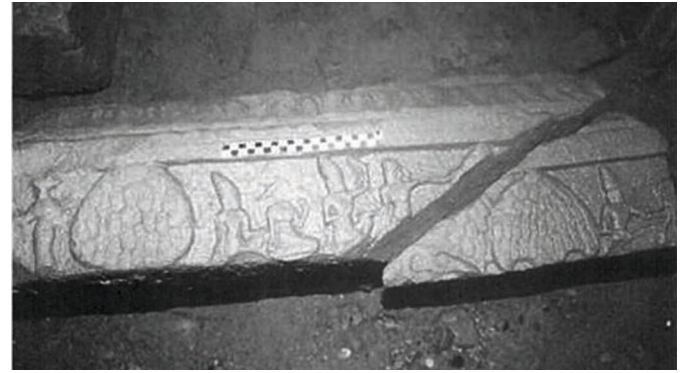
Figure 5. — Relief IV. Rāma et Sītā – Sītā aperçoit la biche dorée (?), x e -xi e siècle, Khương Mỹ (Quảng Nam, Vietnam). Grès, env. 85 × 21 cm.

l'un des angles de la tour sud par exemple, ce relief permettrait de faire coïncider le parcours du dévot commençant alors sa circumambulation et celui des trois héros de l'épopée qui se dirigent vers leur nouvelle demeure à Pañcavaṭī.