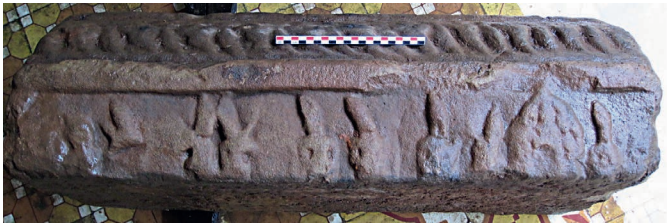
Figure 14. — Relief VIII. La recherche de Sītā (?), x e -xi e siècle, Khương Mỹ (Quảng Nam, Vietnam). Grès, env. 78 × 20 cm. Réserve du site.