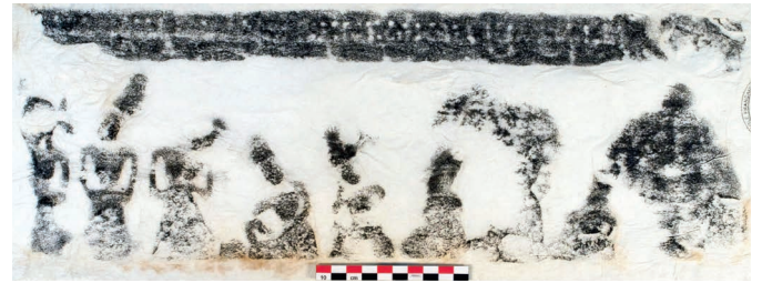
Figure 24. — Estampage EFE0 n. 2094, légende du relief n° I (fig. 2).