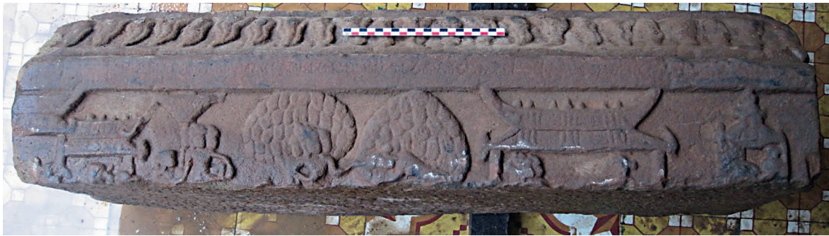
Figure 16. — Relief X. À Lañkā, dans le complexe palatial – Rāvaṇa et Sītā dans le bois d’ aśoka , x e -xi e siècle, Khương Mỹ (Quảng Nam, Vietnam). Grès, env. 99 × 24 cm. Réserve du site. Cliché Arlo Griffiths (2011).

livre III 52 . Nous relèverons ici ceux qui nous paraissent les plus prometteurs quant à l’identification de ce relief. Au chapitre 68 53 , Rāma procède à l’incinération de Jaṭāyus. L’épisode du bûcher funéraire de Kabandha, un rākṣasa prodiguant, tout en se consumant, ses conseils aux deux héros, est développé au fil des chapitres 72 et 73 54 . Toutefois, ce personnage est rencontré dans la forêt et le Rāmāyaṇa de Vālmīki précise que le feu est allumé dans « une caverne dans la montagne » 55 . Enfin, au chapitre 74 56 , les deux frères assistent à l’immolation de l’ascète Śabarī, qui vit quant à elle dans un ermitage au bord de la Pampā. C’est à cette dernière proposition que nous sommes les plus favorables, car ce relief semble véritablement conclure la longue série d’épisodes rapprochés dans le temps et dans l’espace. Comme l’exprime M. Biardeau, Śabarī « semble clore la parenthèse qui s’est ouverte au Citrakūṭa (...), postée elle aussi à un seuil (...), [elle] est la dernière rencontre humaine avant l’arrivée chez les singes » 57 .