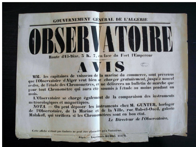
Figure 3 – Affiche de l'observatoire d'El-Biar (vers 1865)

Il souligne aussi l'abondante et brutale pluviométrie d'Alger. Les acteurs de l'astronomie française à Alger sont d'ailleurs régulièrement mis en difficulté par les conditions climatiques ordinaires ou la violence de certains épisodes météorologiques : instabilité de l'équatorial coudé sous le vent, oxydation des miroirs, blocage des montures en bois en raison de l'humidité, extinction régulière des lampes à pétrole sous les coups de vent pendant les observations, réfection régulière des peintures côté ouest et même destruction de la toiture de l'instrument méridien en 1889 et de l'installation de télégraphie sans fil en 1916 33 .