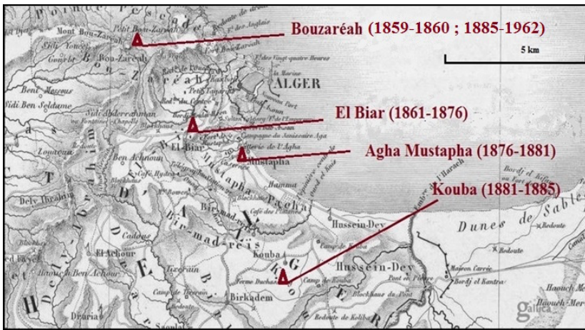
Figure 2 – Observatoires de l'État à Alger (1859-1962)

vatoire d'El-Biar mentionnent ainsi à la fois son installation au bord d'une voie de communication principale et la distance, qui peut être parcourue à pied dans l'heure 32 (figure 3). En 1874, un câble télégraphique est déroulé par bateau depuis la métropole jusqu'au port d'Alger. L'entrelacement télégraphique place le port au centre d'un réseau technique. Une extension lie le bout du câble à l'observatoire qui est un point émetteur et récepteur. L'observatoire, alors figé dans sa forme « définitive », reste ainsi ancré au port depuis 1830.