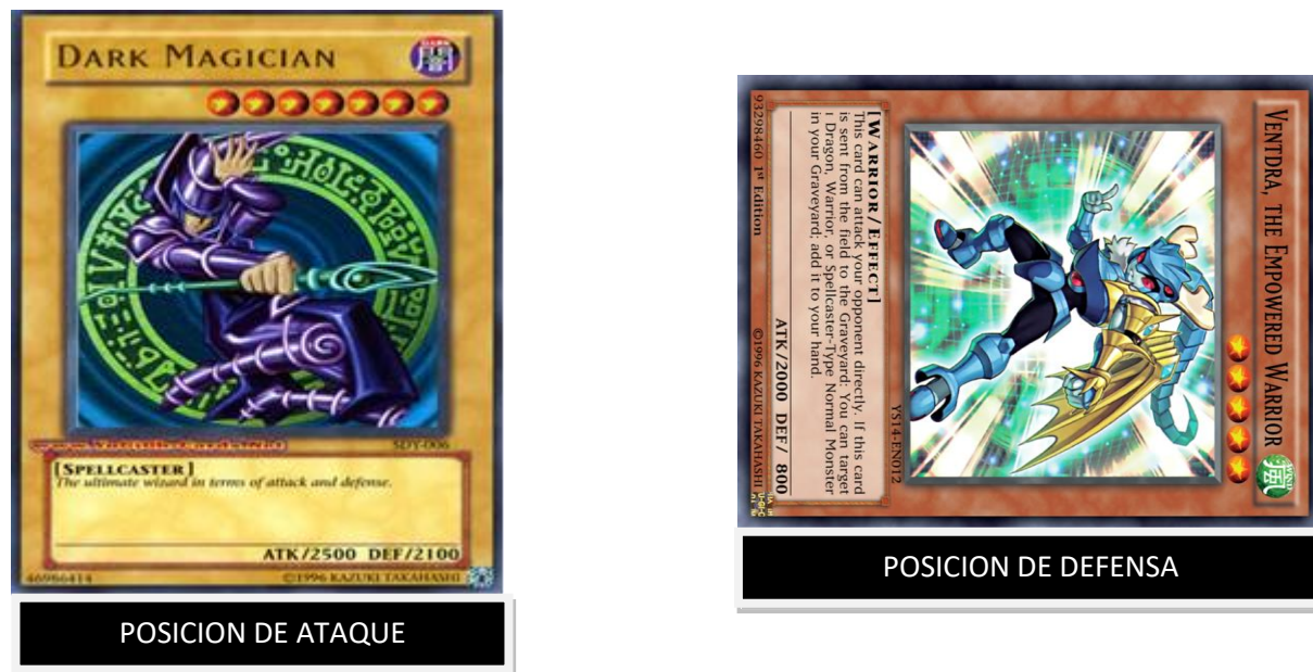
Figura 4: Posición de ataque y defensa de la baraja Yu-Gi-Oh

Si ambos monstruos están en posición de ataque se restará la diferencia del total de puntos de vida (en este ejemplo el Mago oscuro posee 2500 y Ventdra 2000) así que el jugador que tuviera a Ventdra en campo perdería la diferencia de puntos de ataque, en este caso 500 y su valor de puntos de vida pasaría de 8000 a 7500. En consecuencia el monstruo que perdió la batalla será mandado al cementerio. Si un monstruo está en posición de ataque y otro en defensa, pero el ataque es mayor que la defensa, entonces se destruirá al monstruo en posición de defensa, pero no se aplica el cálculo de daño y los puntos de vida quedan a salvo, el monstruo en posición de defensa será mandado al cementerio. Si un monstruo está en posición de ataque y otro en defensa, pero el ataque es menor o igual que la defensa ninguno de los monstruos es destruido,