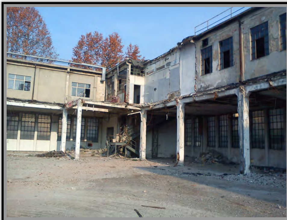
Fabbrica abbandonata - Cortile Foto- Daniel Senovilla, Dicembre 2011