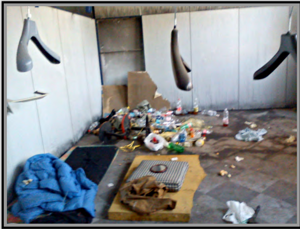
Stanza all'interno della fabbrica abbandonata Foto- Daniel Senovilla, Dicembre 2011