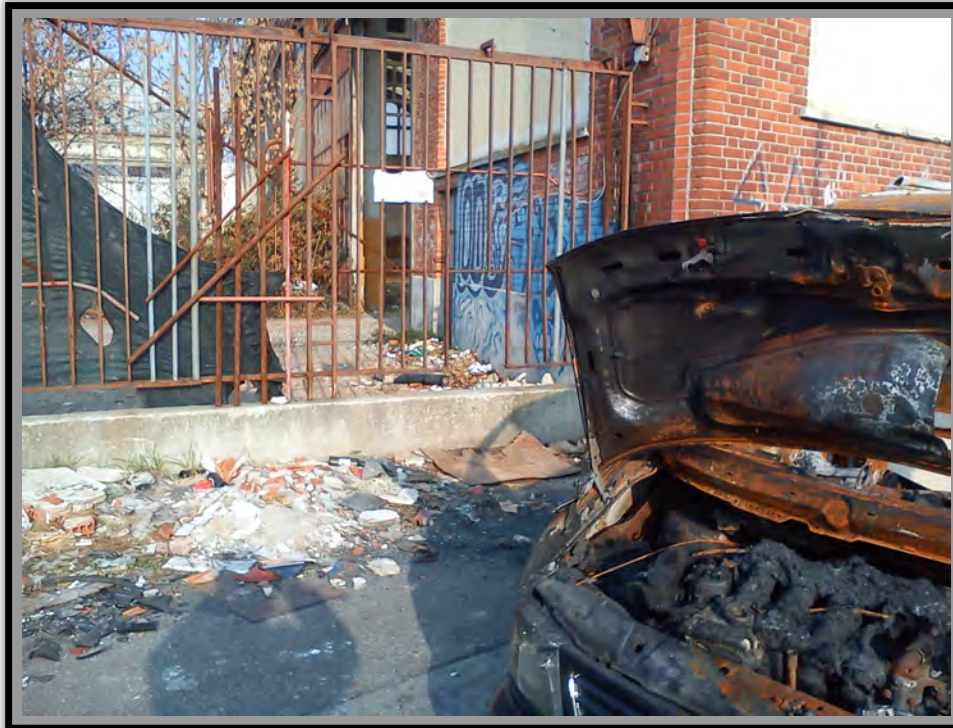
Accesso alla fabbrica abbandonata dove vive un gruppo di minori stranieri non accompagnati Foto- Daniel Senovilla, Dicembre 2011