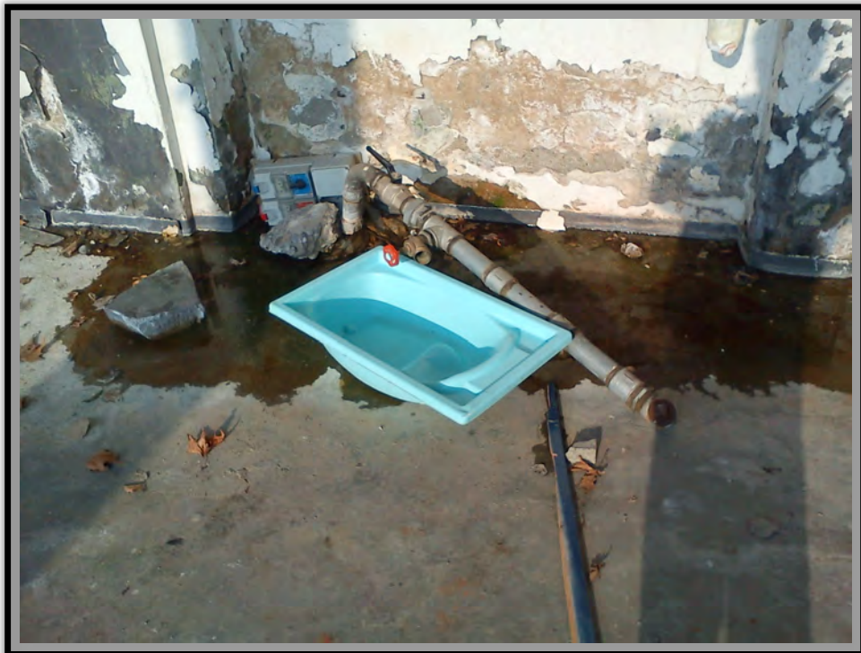
Punto di accesso all'acqua nella fabbrica abbandonata Foto- Daniel Senovilla, Dicembre 2011