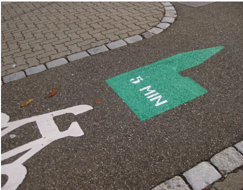
Figure 4 : Jalonnement piéton à Nantes

Marques au sol, à Strasbourg, indiquant la direction et le temps d'accès à la cathédrale.