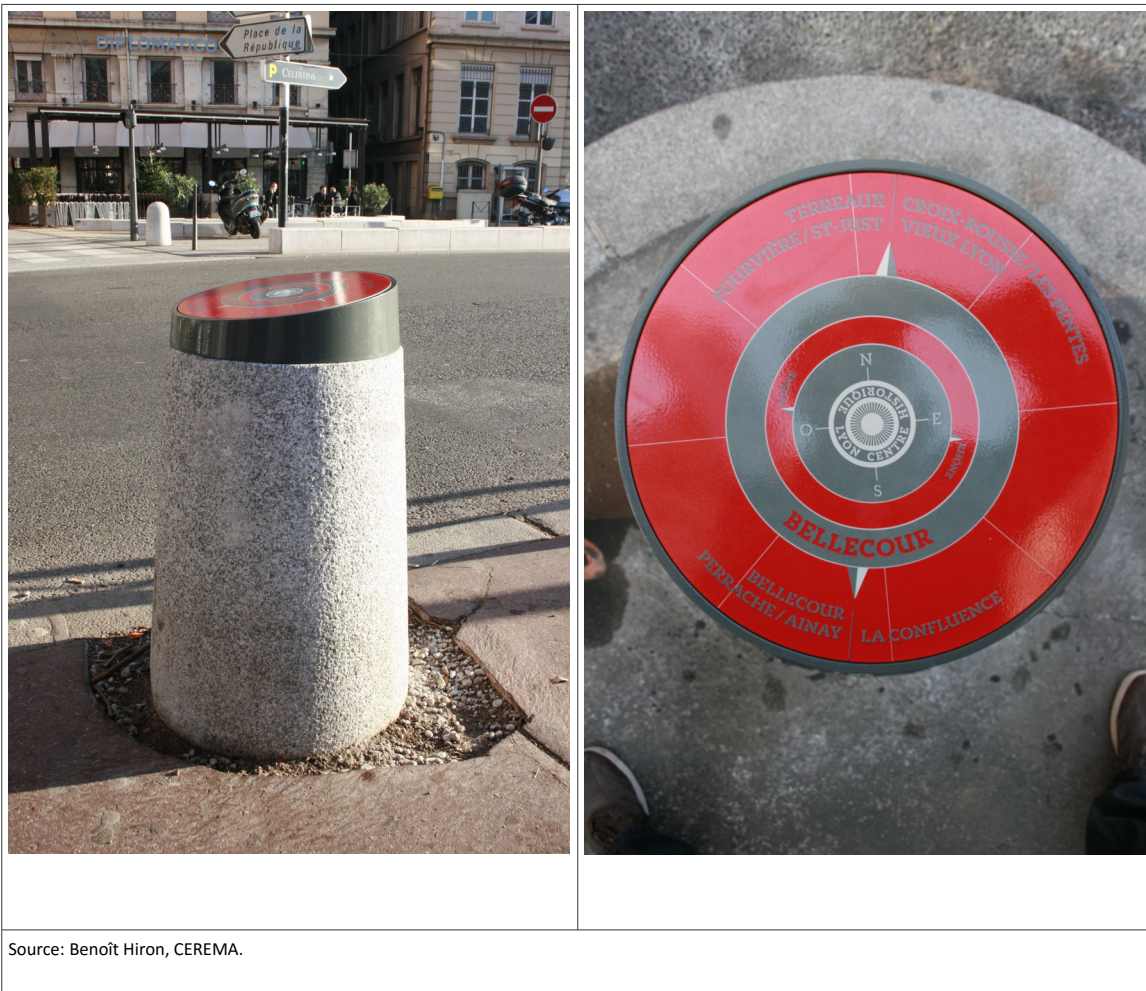
Figure 10 : Rosaces sur bornes, à Lyon.