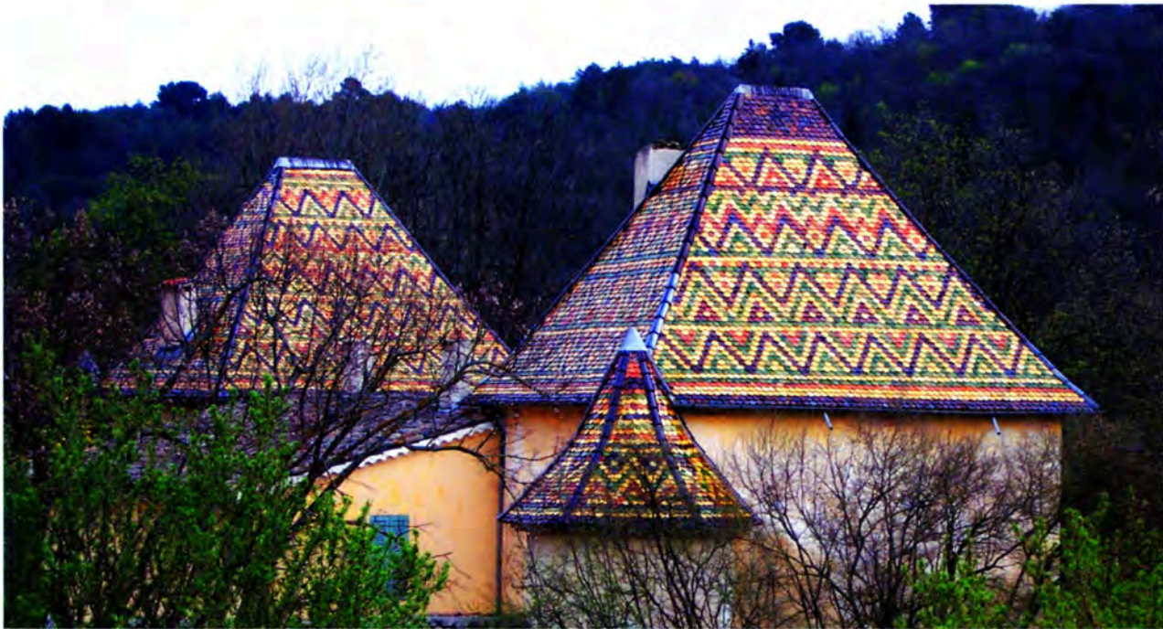
Fig. 7 : Toitures restaurées du Château de Campagne, Riez.

Un autre carrelage en terre vernissée provenant de l'église paroissiale de Châteauneuf-les-Moustiers a été conservé en partie (Fig. 8). Il devait alterner les malons à décor incisé de feuilles de chêne inscrites dans les triangles formés par les diagonales du cadre de bordure, dont 8 ont survécu au dépeçage et des pièces monochromes vertes ou jaunes, dont 15 nous sont parvenues. S'y ajoutaient un carreau au moins représentant un oiseau gravé du type de ceux qui figurent sur les fonds d'écuelles ou de plats de