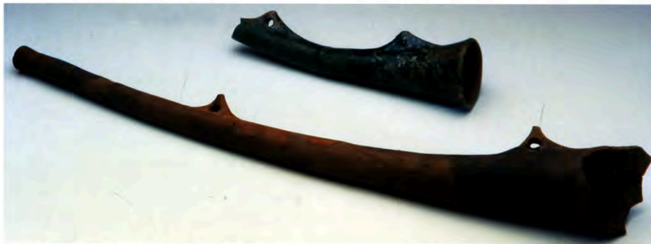
Fig. 2 : Trompes d'appel du château de Faudon, XIV e s.

Au milieu de ces importations (?), les trompes d'appel du château de Faudon découvertes en 1907, l'une en terre brute, l'autre sous couverte verte, sans doute datables du XIV e siècle, posent un problème particulier en ce qu'elles ne sont pas attribuables à une production connue à ce jour (Ganet, Pelletier 1995) (Fig. 2).