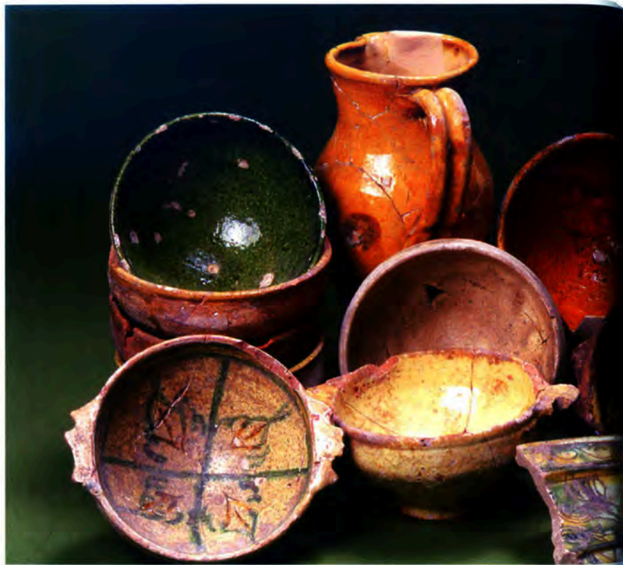
Fig. 3 : Pichet, bols, écuelles Couvent de la Visitation, Sisteron, fin XV e s.

La tuilerie au Moyen Age constitue un secteur stratégique et s'assurer les services d'artisans compétents est une des priorités des communautés provençales, or ces derniers sont rares. C'est peut-être pour cela que la tuilerie bas-alpine et de façon plus générale provençale est littéralement dans la main d'artisans