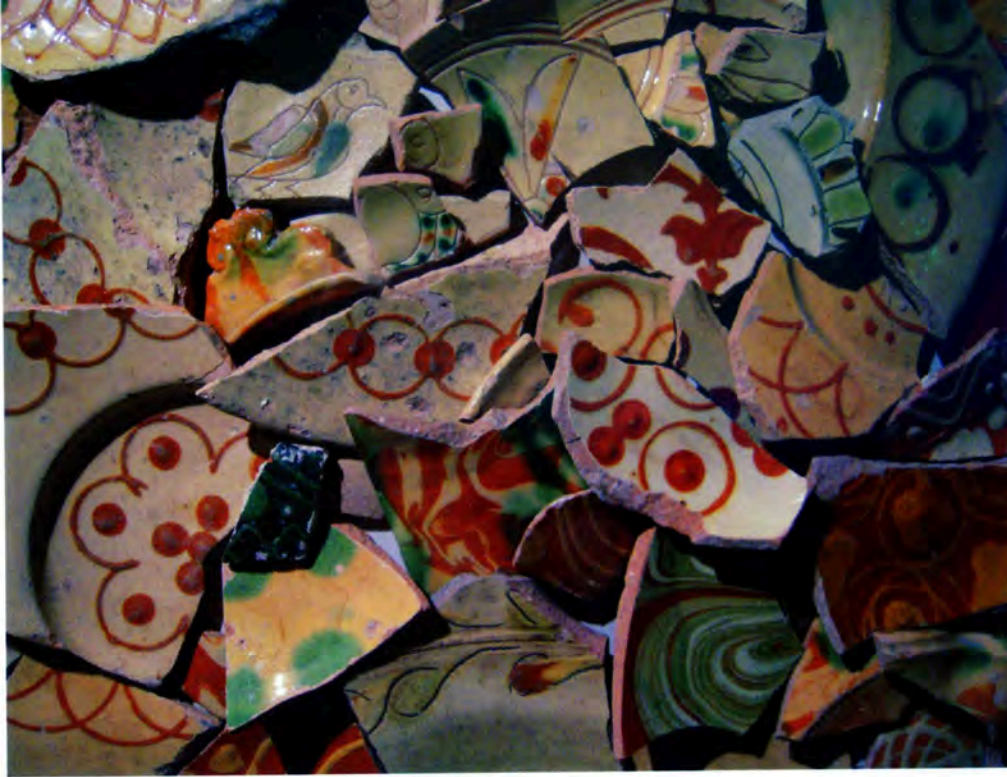
Fig. 6 : Tessons de plats et écuelles à décors incisés, marbrés ou au barrolet, dépôtort Bondil, Moustiers XVII e s. Musée de Moustiers.

En revanche, que dire des décors d'engobe posés au barrolet et imprimés qui leur sont associés, de cercles sécants, fuseaux, rouelles, gouttes, feuillages etc. sinon qu'ils appartiennent sans doute bien plus à une tradition régionale et locale et qu'ils sont mis en œuvre dès une époque antérieure au temps des incisées (Fig. 6).