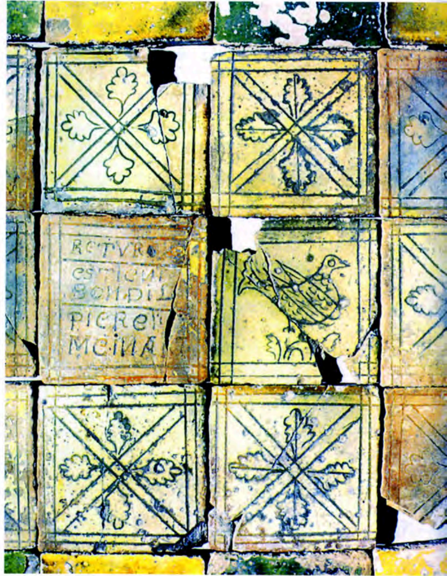
Fig. 8 : Carreaux du pavement de l'église de Château-neuf-les-Moustiers, Musée de la Palud-sur-Verdon.

A ces fabriques modestes s'ajoutait un certain nombre de tuileries et/ou briqueteries moins exactement recensées.