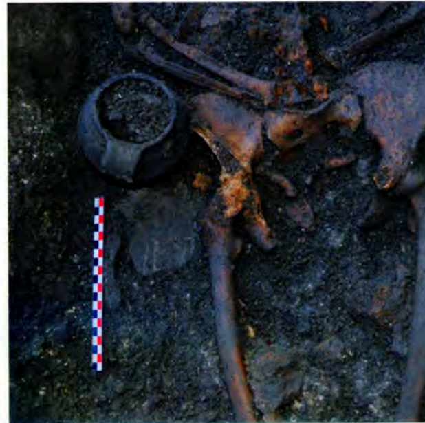
Fig. 1 : Pégaus de la nécropole de l'église de Senez XIII e s.

Curel, de Ganagobie, de Saint-Michel de Cousson (Démians d'Archimbaud, Pelletier 1995 ; Fixot, Pelletier 1995 ; Pelletier 1995 et 1996 ; Zérubia 1995a ; Bailly 2011), de Salagon, de ceux du Pré de Foire - Pré du Chapitre de Riez (Guionova 2011), de la cathédrale de Sisteron, à Senez (Dupuis et al. 2015), Castellane, Céreste (Bailly à paraître) ou bien encore de découvertes isolées, toutes s'inscrivent dans une chronologie des XII e -XIII e siècles, avec de notables variations de taille, la présence ou l'absence de bec, d'anses, ou de rares décors imprimés à la roulette ou à la molette. (Fig. 1)