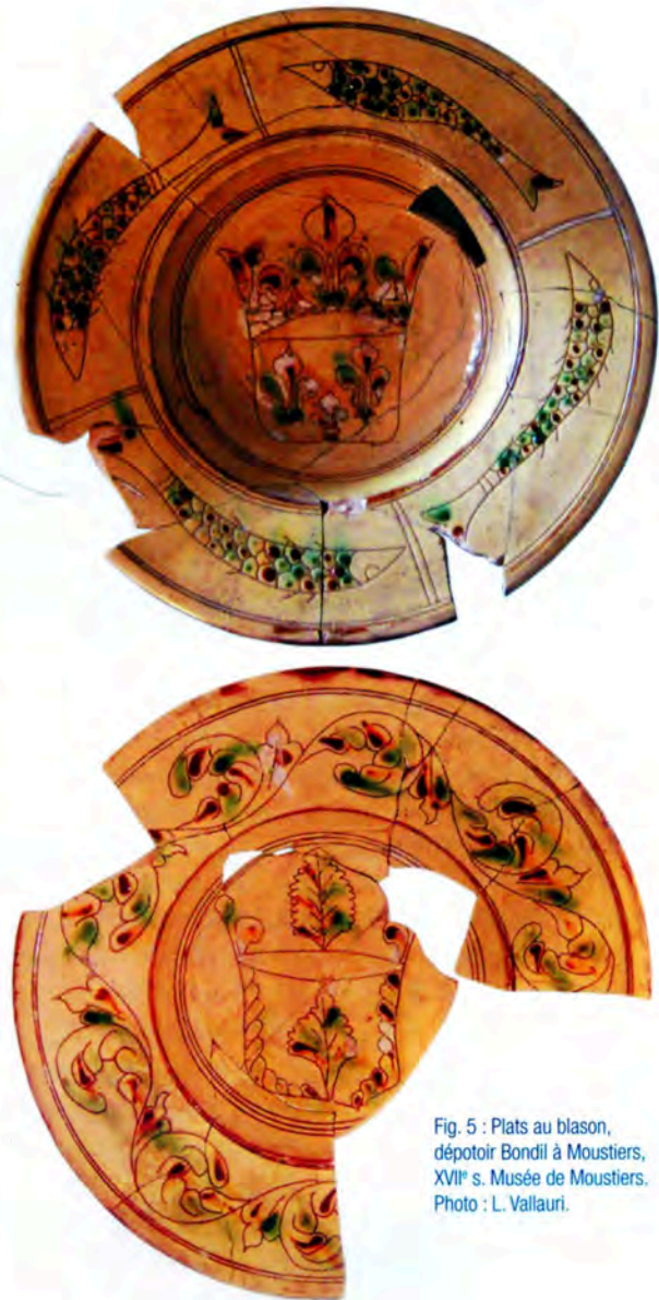
Fig. 5 : Plats au blason, dépôt de Bondil à Moustiers, XVII e s. Musée de Moustiers.

De même, il existe dans les gammes de Moustiers issues de ce même ensemble et de celui de Saint-Jeannet, des pièces revêtues d'engobes mêlés qui s'inscrivent bien dans la tradition toscane.