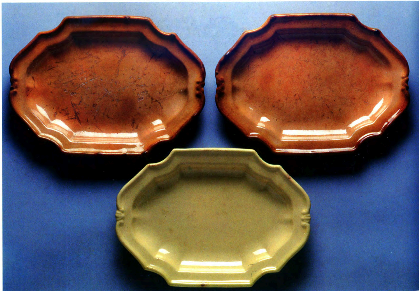
Fig. 9 : Plats timbrés de la fabrique Bousquet de Manosque et modèle d'Apt, coll. Part.