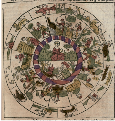
Le propriétaire des choses, Huss, 1482, « Du temps », gravure, folio 136 r° (BmL Rés Inc 1042)