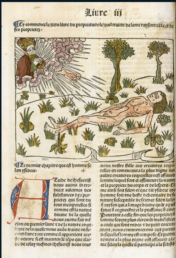
Le propriétaire des choses, M. Huss, 1482, « De l'âme », gravure, folio sign. b8 v° (BmL Rés Inc 1042)

L'apparition de l'imprimerie vers 1450 confirme le succès de cette œuvre. Au XV e siècle, on en produit vingt-trois éditions en Europe: douze en latin, huit dans la traduction française de Corbechon, une en espagnol, une en anglais et une en néerlandais, ce qui montre la popularité de cette encyclopédie, surtout en France. Les imprimeurs lyonnais, en particulier, s'intéressent au De proprietatibus rerum puisque de Lyon sortent trois éditions latines et sept éditions françaises. Ces sept éditions lyonnaises de la traduction de Corbechon, auxquelles nous nous intéresserons plus particulièrement ici, sont celles imprimées par Matthias Huss le 12 novembre 1482, le 12 octobre 1485, le 7 avril 1487 et le 15 mars 1491, celle de Jean Siber vers 1484, celle de Guillaume Le Roy du 26 janvier 1485 et enfin celle de Claude Davost du 17 avril 1500 2 .