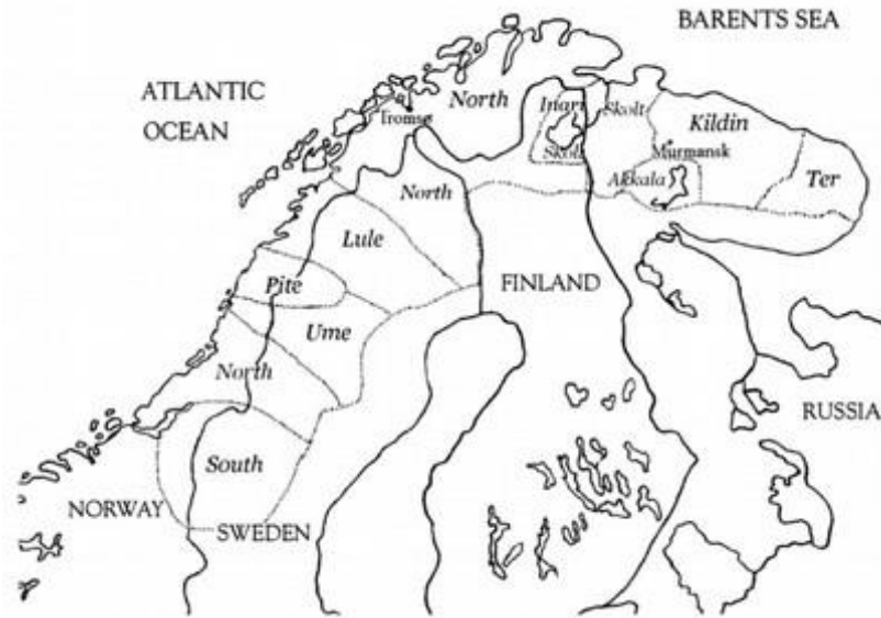
Figure 1. Carte des langues sames (Toivonen & Nelson 2007 : 3)

Les langues sames sont organisées en continuum dialectal : les frontières linguistiques sont peu marquées, sinon fluctuantes, et les langues les plus proches géographiquement sont au moins partiellement intercompréhensibles. Ainsi, le domaine same forme un réel diasystème , c'est-à-dire un ensemble de dialectes et langues cohérent (Sammallahti 1998 : 1-5).