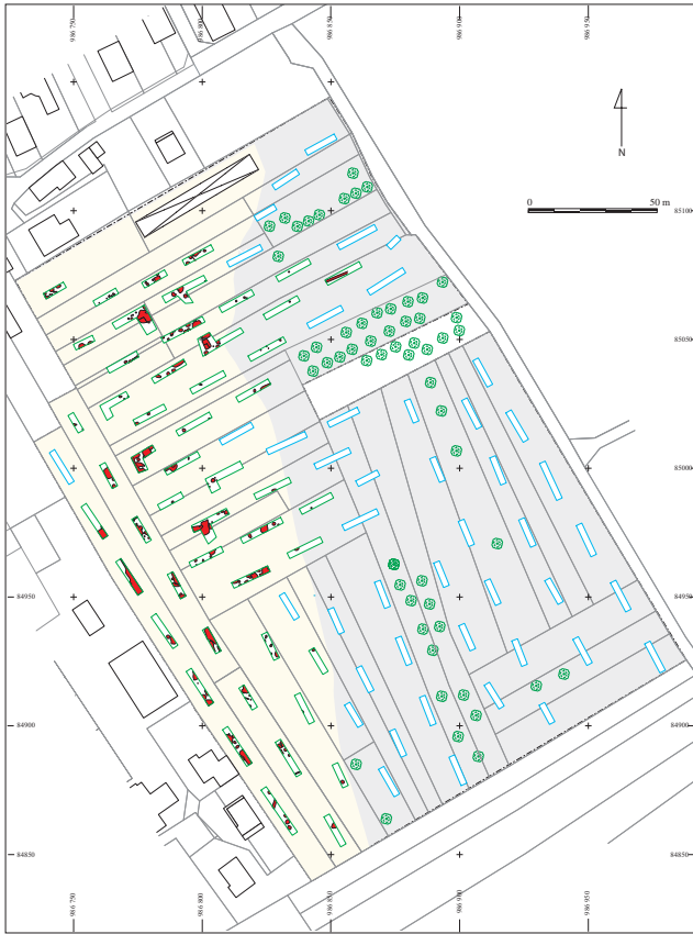
Fig. 1 : Plan de localisation des sondages réalisés à Sermersheim à l'emplacement d'un futur lotissement. Les tâches sombres correspondent à des structures d'un habitat dont l'occupation est estimée couvrir les VII e -XII e siècles (P. Girard, É. Peytremann, J.-L. Wuttman del.).

Parallèlement à ces débats basés sur les résultats publiés, s'opère sur le terrain une transformation majeure dans la pratique archéologique nationale. Le développement sans précédent de l'archéologie préventive va en effet, comme dans d'autres domaines, profondément transformer l'archéologie de l'habitat du haut Moyen Âge.