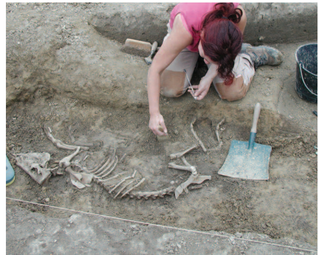
Fig. 3 : Fouille du squelette d'une truie enterrée dans un fond de cabane sur le site de Sermersheim (Bas-Rhin)

Dans plusieurs régions, les fouilles d'habitat sont en effet confiées aux mains de responsables formés à la période et familiarisés à ce type d'opération. Progressivement apparaissent des équipes locales qui, pour certaines, commencent à s'organiser pour tenter de rassembler les données archéologiques parfois fort nombreuses et pour les rendre accessibles à la communauté scientifique. Ainsi un Projet collectif de recherche établi sur trois ans voit le jour en 1998 dans les Pays-de-la-Loire, sous l'impulsion d'Alain Valais. La construction de deux autoroutes (A 83 et A 85), d'un aérodrome et du contournement de la ville de Saumur sont en effet à l'origine d'un accroissement significatif du nombre de sites d'habitat rural du haut Moyen Âge, méconnus dans cette région. Au bout des trois ans, cinquante notices normalisées de sites ont ainsi été rédigées.