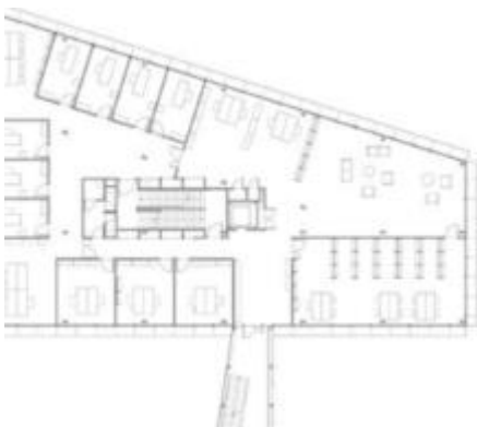
Plan niveau 1A Ensa Nantes © Archibooks + Sautereau

Un don sur l'acoustique et l'éclairage et un autre concernant la modélisation et la synthèse d'image viennent enrichir le fonds.