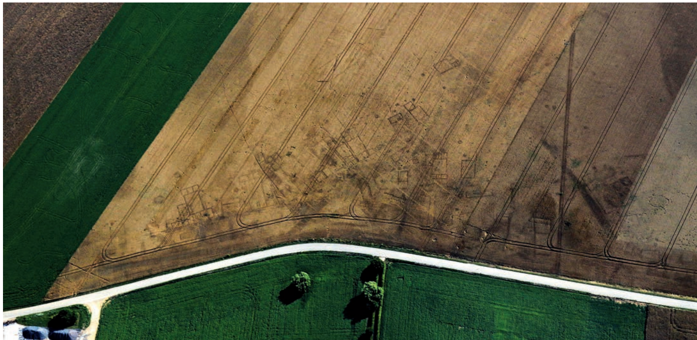
Fig. 2 – Bricon, la Maison-Dieu (Haute-Marne) : une agglomération routière encore occupée aux IV e et V e s. apr. J.-C..

certain nombre d'agglomérations à valeur d'exemple a donc été traitée sur la longue durée, du III e au VI e s. apr. J.-C. En faisant référence au cadre administratif de la fin du IV e s., tel qu'il nous a été transmis par la Notitia Galliarum , ce sont donc l'intégralité de la province de Lyonnaise Troisième ainsi que des parties significatives des Lyonnaises Première et Quatrième, de la Grande Séquanie et de la Germanie Seconde, auxquelles s'ajoute l'Alémanie, qui ont été prises en compte (fig. 1). Ces territoires correspondent aussi, pour une bonne part, aux régions actuelles évoquées plus haut et qui ont bénéficié d'un renouvellement des connaissances dans le cadre de programmes collectifs.