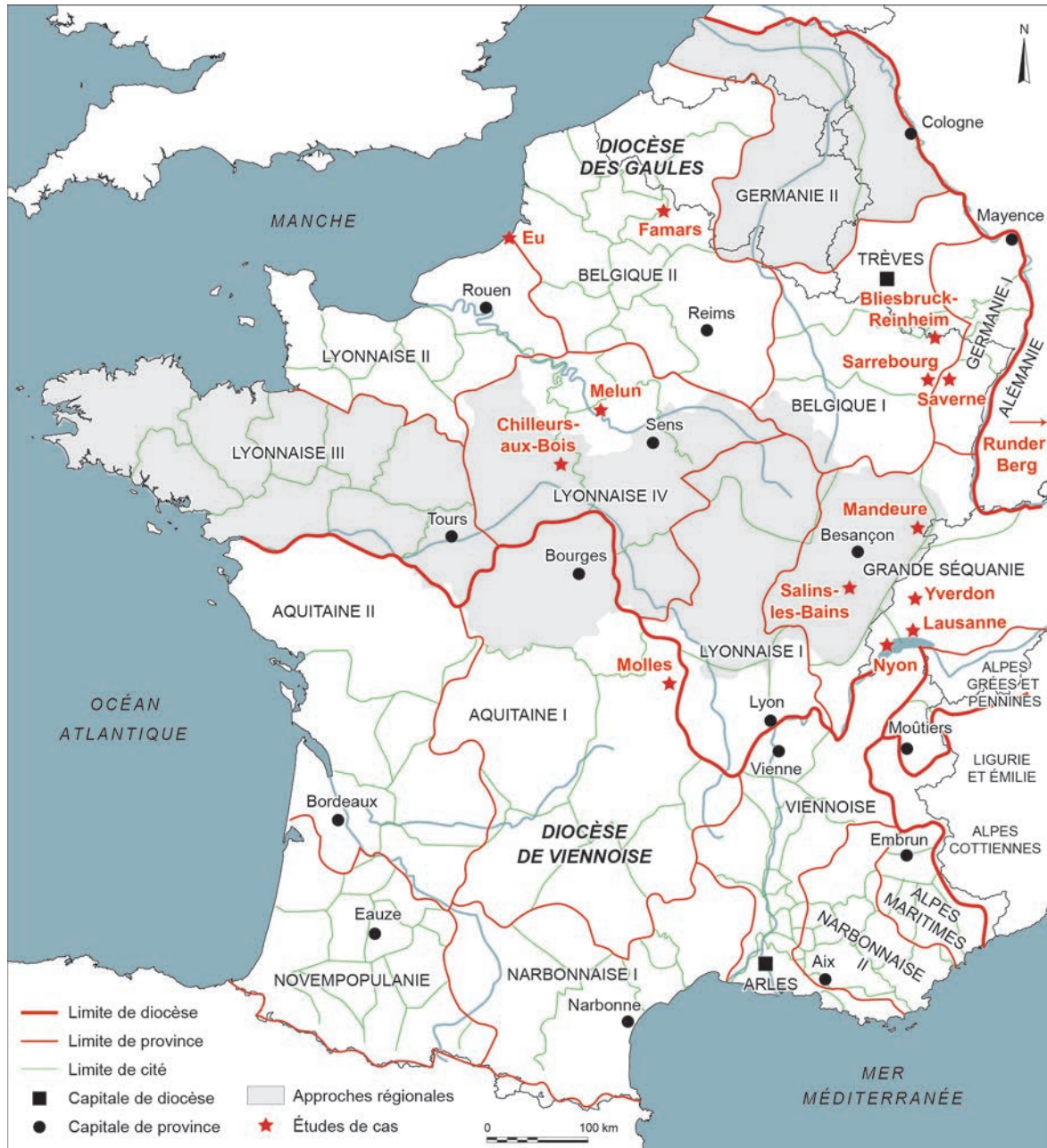
Fig. 1 – Sites et régions examinés dans le cadre de ce dossier, sur fond de carte des provinces des Gaules et des Germanies à la fin du IV e s. apr. J.-C. (DAO : M. Monteil, université de Nantes).