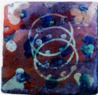
Fig. 3 carreau au décor de cercles sécants pointés

D'autres techniques, comme la pose à l'aide de matrice ou de « verres de lampe », permettent de dessiner des cercles juxtaposés ou sécants (fig.3). Des feuilles polylobées sont également identifiées en petit nombre, ponctuées de gouttes d'engobe blanc ou rouge (fig.4). Cette bichromie des terres est rehaussée par des taches ou coulure d'oxyde de cuivre vert, de brun de manganèse violacé ou d'oxyde de fer jaune miel. Les couleurs chaudes sont ravivées par la couverte brillante de glaçure jaune clair à l'alquifoux (sulfure de plomb).