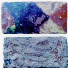
Fig 5 placage incisé à décor de triangles

En dehors des petits carreaux, une dizaine de plaques rectangulaires de 12 x 21cm, soit la dimension de deux carreaux assemblés, ont été incisées à la pointe divisant la surface en triangles remplis soit d'engobe blanc, soit de glaçure colorée en brun, orangé, vert et jaune clair (fig.5). Percées à leurs extrémités pour une fixation sur des montants, les plaques retrouvées à l'emplacement de l'embranchement de l'autel latéral pourraient l'avoir revêtu.