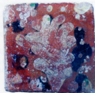
Fig 4 carreau au feuillage centré et écoinçons.

D'autres techniques, comme la pose à l'aide de matrice ou de « verres de lampe », permettent de dessiner des cercles juxtaposés ou sécants (fig.3). Des feuilles polylobées sont également identifiées en petit nombre, ponctuées de gouttes d'engobe blanc ou rouge (fig.4). Cette bichromie des terres est rehaussée par des taches ou coulure d'oxyde de cuivre vert, de brun de manganèse violacé ou d'oxyde de fer jaune miel. Les couleurs chaudes sont ravivées par la couverte brillante de glaçure jaune clair à l'alquifoux (sulfure de plomb).