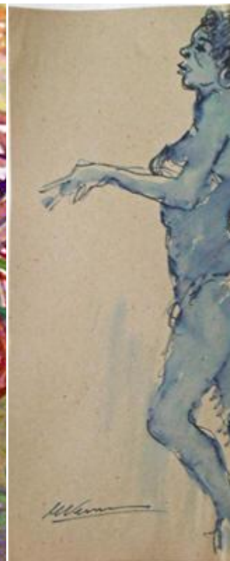
Eduardo Vernazza : « Candombe », acuarela y tinta sobre papel, 30x50, s.d.