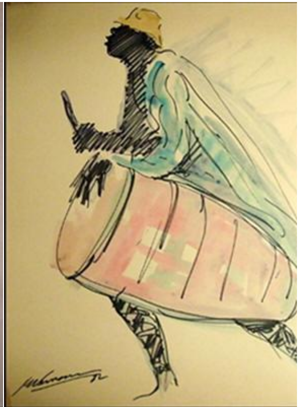
Eduardo Vernazza : « Candombe », drypen y acuarela sobre cartón, 40x60

Designa a ese instrumento musical y, luego, a la danza que se asocia a la ceremonia