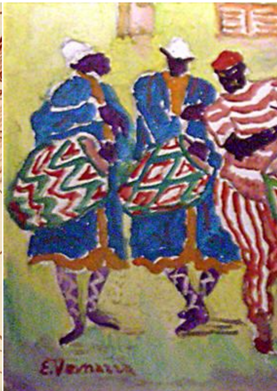
Eduardo Vernazza : « Candombe », óleo sobre tela, 40x60, s.d.