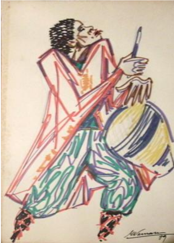
Eduardo Vernazza : « Candombe », drypen y acuarela sobre cartón, 40x60