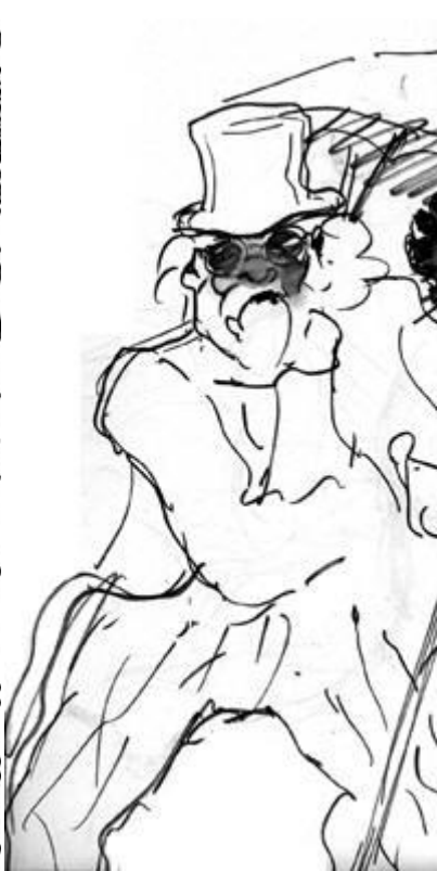
Eduardo Vernazza : « Candombe », tinta sobre papel, 30x50, s.d.