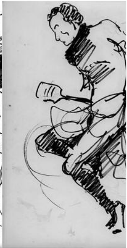
Eduardo Vernazza : « Candombe », tinta sobre papel, 30x50, s.d.