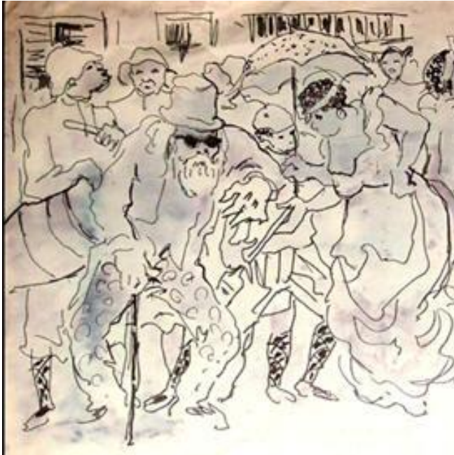
Eduardo Vernazza : « Candombe », acuarela y tinta sobre papel, 50x70, 1982

religiosa del Candomblé. Los hablantes de la lengua kikongo traducen « Candombe » como « lo que es propio de negros ». El sociólogo brasileño Artur Pereira Ramos observa que « en Uruguay y en Argentina, el término subsiste con el sentido más general de 'danza de negros' ».