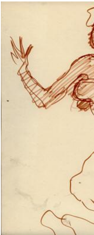
Eduardo Vernazza : « Candombe », tinta y lápiz sobre papel, 30x50, s.d.

Tal contenido semántico linda con la burla del rey en el universo bantú. En el marco de las realezas africanas, el cuerpo del rey es el símbolo del cosmos y del orden establecido. Atacarlo, aunque sólo sea mediante la burla, es destruir el orden cósmico y entrar en un período de caos. En consecuencia, el Candombe es la puesta en escena, de hecho muy estudiada, de ese caos. Por consiguiente, aparece como una notable creación sincrética afro-euro-americana.