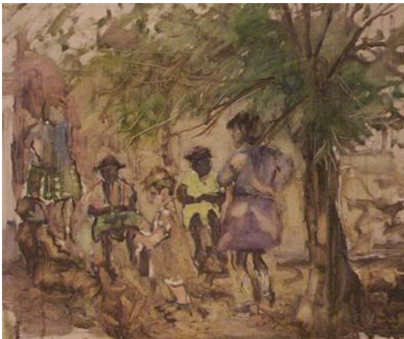
Eduardo Vernazza , óleo sobre tela, 40x60, s.d.

En esa época, parecería que las « naciones » afro-uruguayas no se perciben a sí mismas como grupos religiosos sino como asociaciones de ayuda mutua, cuya vocación es organizar fiestas populares. En el artículo citado, Rama señala que las « naciones » no se desarrollan como sectas religiosas ni como grupos políticos. Su función es contribuir de modo vigoroso al surgimiento de una cultura uruguaya constituida, asimismo, por elementos europeos. La situación social de los afro-uruguayos es similar a la de los inmigrantes que vienen de Europa. Unos y otros se instalan en barrios proletarios.