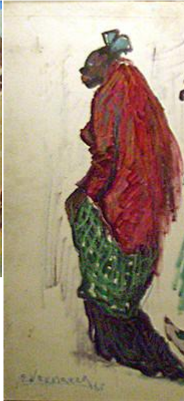
Óleo sobre tela 40 x 60