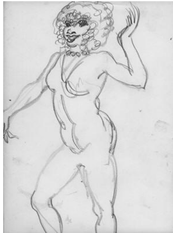
Lápiz sobre papel 30 x 50

La mayoría de esas manifestaciones son propias de la « nación bantú » : esclavos originarios de África ecuatorial y austral, que se encuentran entre los últimos en llegar a