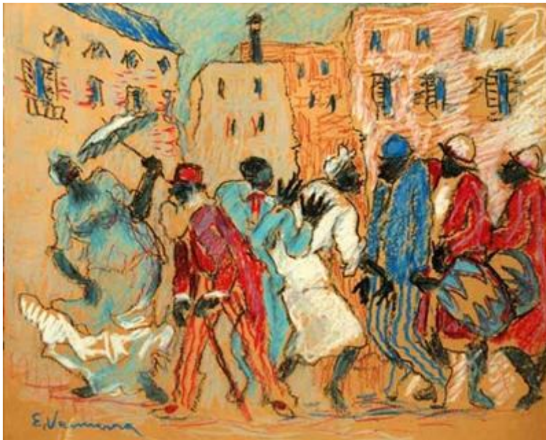
Óleo sobre tela 40 x 60 Eduardo Vernazza : « Candombe », óleo sobre tela, 50 x 70

« Es el descenso de la cofradía africana a las calles bulliciosas del casco urbano, no ya bajo la forma de un conjunto de sacerdotes y fieles sino más bien bajo la apariencia de una corte, con su rey, su reina, sus príncipes, sus guardias y sus damas de honor... es el candomblé sin transe ni posesión... »