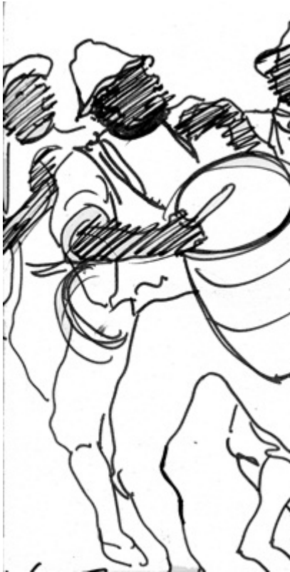
Eduardo Vernazza : « Candombe », tinta sobre papel, 30x50, s.d.

alrededor del fuego para calentar la piel de sus instrumentos. En África todavía puede verse un espectáculo semejante. Pero en Uruguay, hoy, hay más músicos blancos que negros. Por consiguiente, el Candombe aparece como una notable creación sincrética.