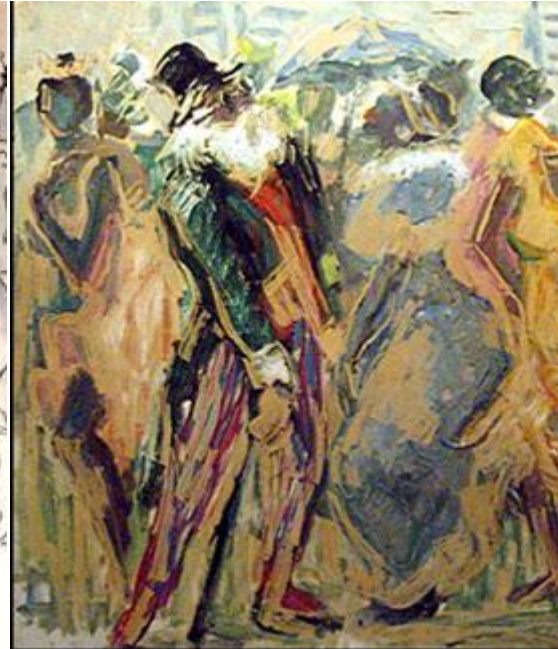
Eduardo Vernazza : « Candombe », óleo sobre tela, 40x60,s.d.