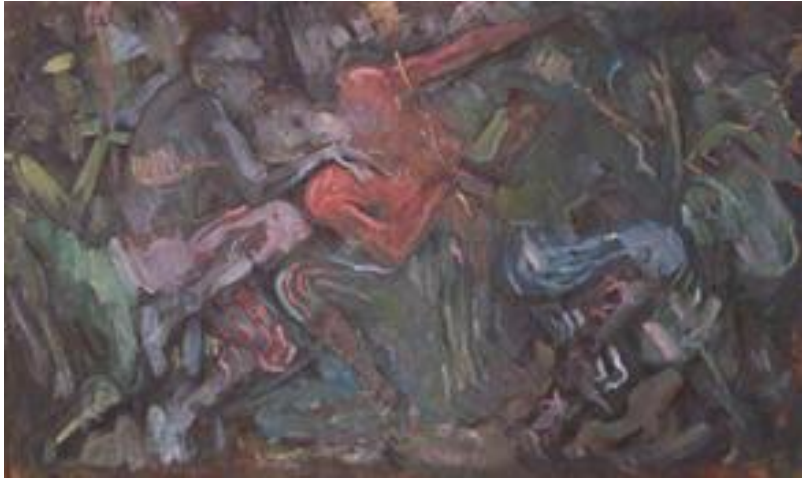
Eduardo Vernazza : « Candombe », óleo sobre tela, 50 x 70