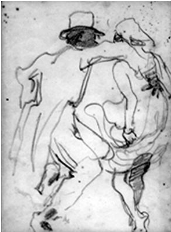
Lápiz sobre papel 30 x 50