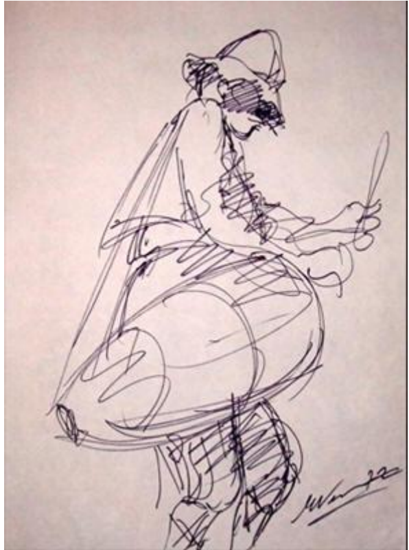
Eduardo Vernazza : « Candombe », tinta y lápiz sobre papel, 40x60, 1972