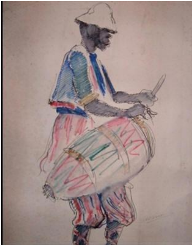
Eduardo Vernazza : « Candombe », drypen y lápiz sobre cartón, 40x60, 1979