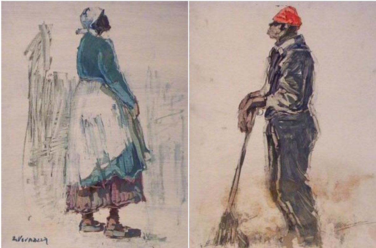
Eduardo Vernazza , esgrafiado sobre tela, 40x60, s.d.

Según Bastide, el hecho « constituye una promoción colectiva » porque permite que las personas de origen africano participen de modo más amplio en la vida social del país. Asimismo, aportan su impronta cultural, especialmente a través del Candombe.