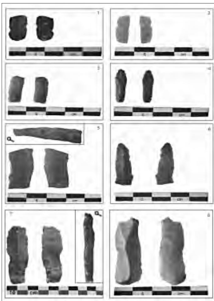
Fig. 1 : BONGHEAT – Les Côtes : matériel lithique recueilli en prospection 1, 2, 3, 4 et 6 : lamelles 5 : fragment de lame retouchée 7 : lame retouchée 8 : lame