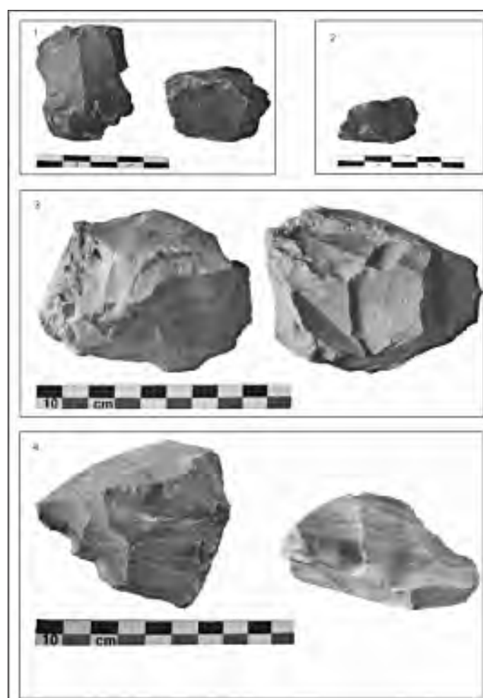
Fig. 2 : ÉGLISENEUVE-PRÈS-BILLOM – Champlong : matériel lithique recueilli en prospection 1, 3 et 4 : nucléus à lames 2 : nucléus à lamelles