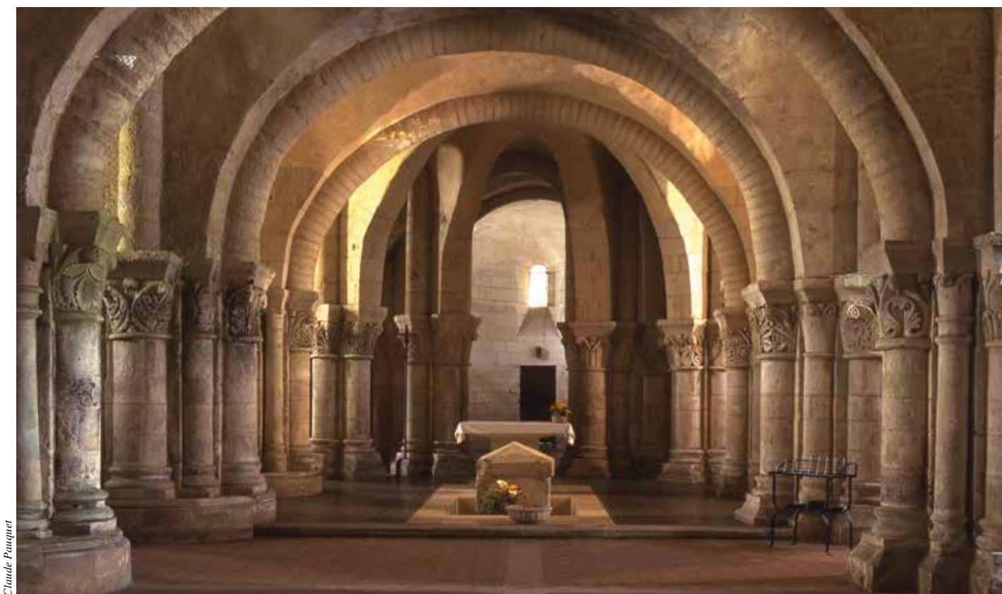
La crypte de l'église Saint-Eutrope à Saintes.