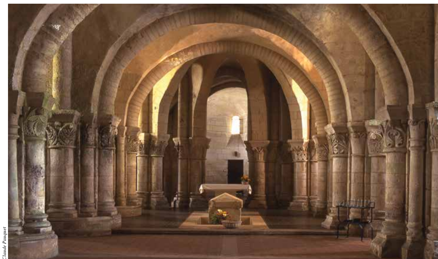
La crypte de l'église Saint-Eutrope à Saintes.