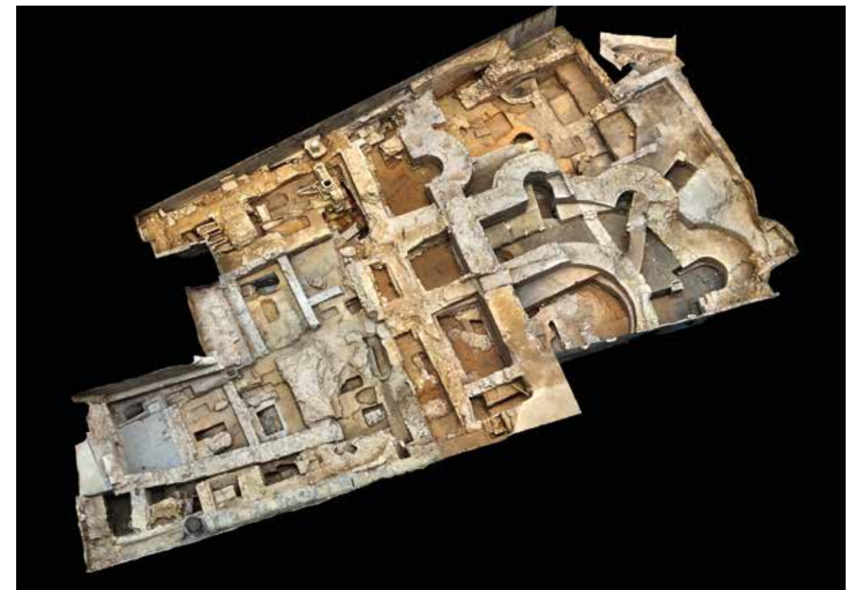
Vue du site de Saint-Martial de Limoges en cours de fouille d'après le relevé 3D effectué en photogrammétrie, réalisation Nicolas Saulière / Éveha 2016.

Mais le monastère est aussi un espace d'accueil selon la règle de saint Benoît, surtout s'il conserve d'importantes reliques et devient de ce fait un lieu de pèlerinage. Il s'agit alors de gérer l'accueil de personnes de plus en plus nombreuses venant de l'extérieur de la clôture sans qu'elles y pénètrent. Il faut leur permettre