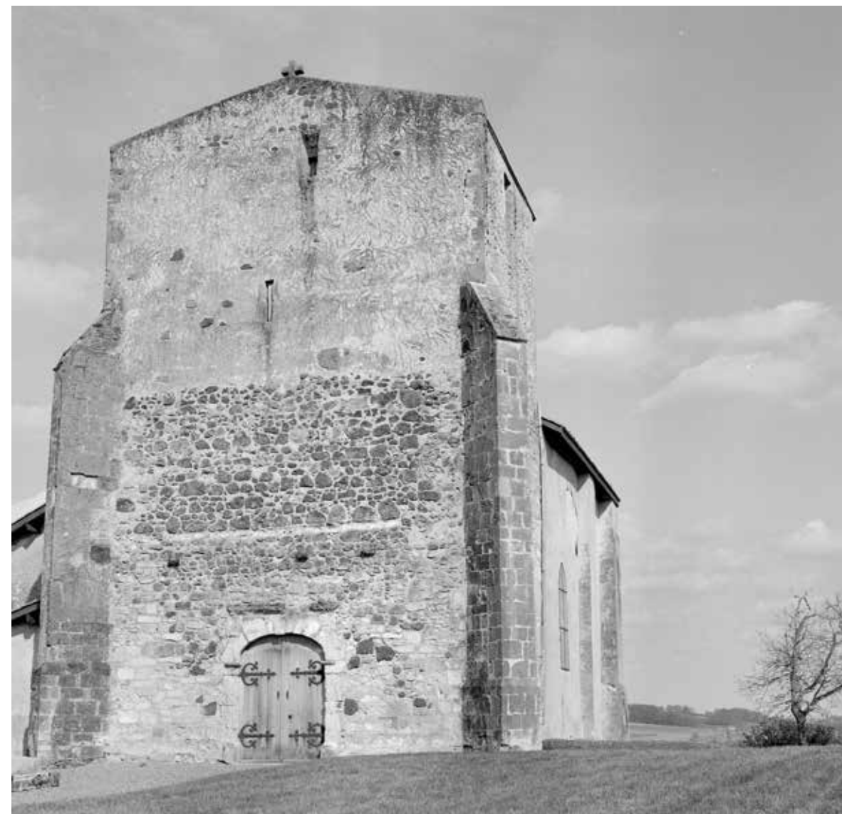
Église et chapiteau de Saint-Aubin, dans les Landes.

M a documentation photographique n'a pas été établie pour l'enseignement, mais pour la recherche. Elle comporte donc beaucoup moins de diapositives, que j'ai principalement utilisées pour des conférences, que de photos noir et blanc qui permettaient des comparaisons entre images. D'une façon générale, les négatifs 24x36 sont de meilleure qualité que les tirages correspondants, effectués trop rapidement par moi-même, car, n'ayant jamais reçu d'aide financière, je devais tout réaliser à mes frais. Mais la qualité des négatifs a évolué avec le temps, en fonction du matériel utilisé et de mes connaissances techniques. Dans l'ensemble, ils sont bien conservés. La technique a été importante, en raison du choix que j'avais adopté d'emblée : faire une couverture systématique de toutes les sculptures romanes d'un édifice, quelles que soient leur situation ou leurs conditions d'éclairage et donc les difficultés de prise de vue et le temps nécessaire. J'ai constaté que ces conditions, ignorées par la plupart des photographes professionnels, ne me permettaient pas d'obtenir auprès d'eux des conseils utiles.