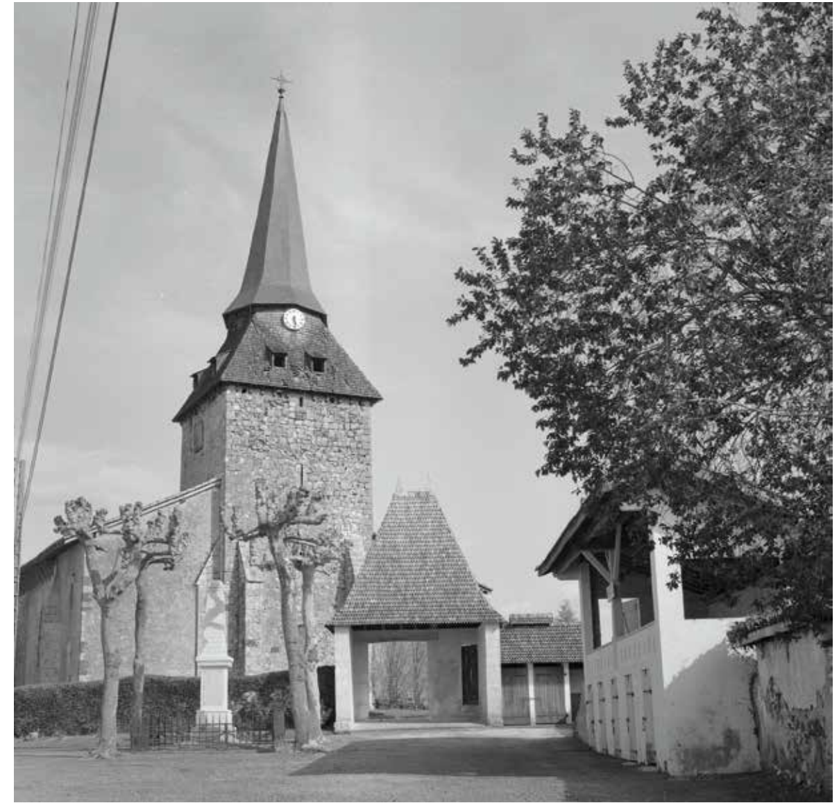
Église de Larbey dans les Landes. Détail de la porte ogivale dite des Apôtres de la cathédrale de Dax. Page de gauche, église de Brocas dans les Landes.