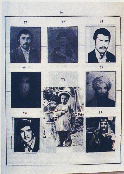
Fig. 34. Martyrs du Jamiat, le parti de Rabbani et de Massoud, dans une publication du parti, 1986 - 1987.