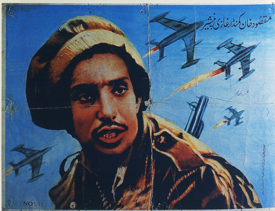
Fig. 32. Le commandant Ahmad Shah Massoud. Dimensions : 35,5 x 28 cm. Imprimé au Pakistan. Acquis 1986. Coll. Pierre et Micheline Centlivres.