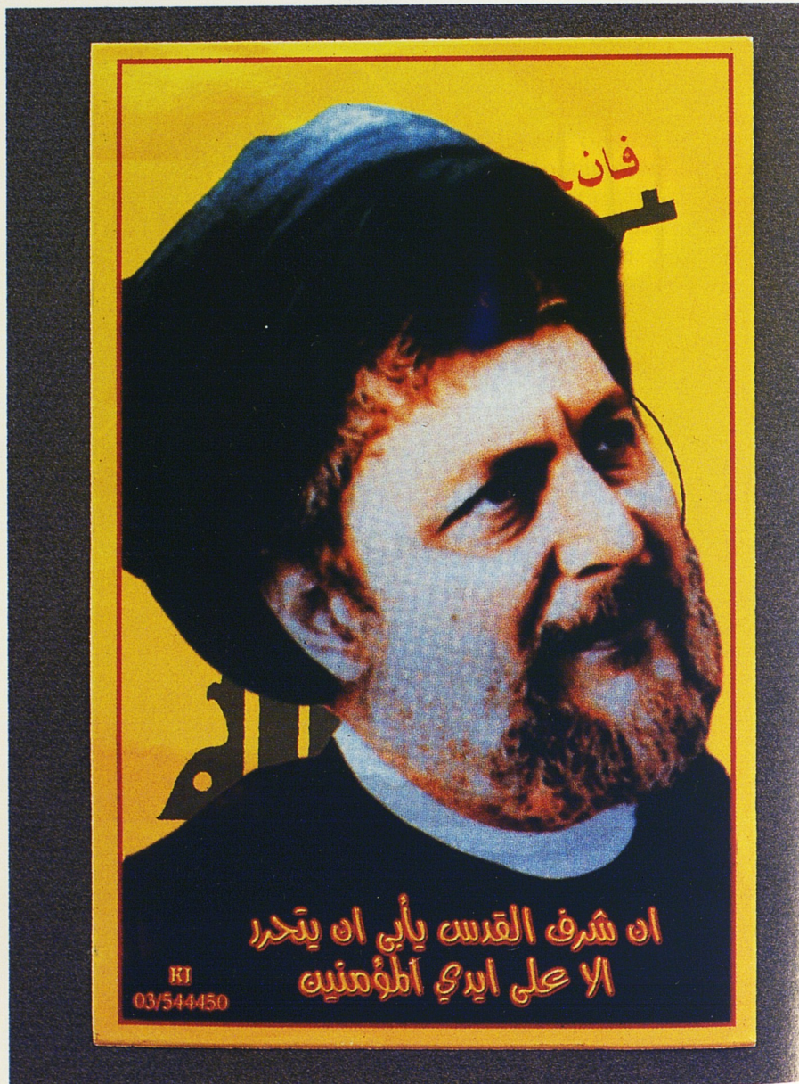
Image de Mûsâ Sadr surimprimée sur le logo du Hezbollah, autocollant du Hezbollah, 15 x 10 cm, acquis Liban, 2000. Coll. Sabrina Mervin.