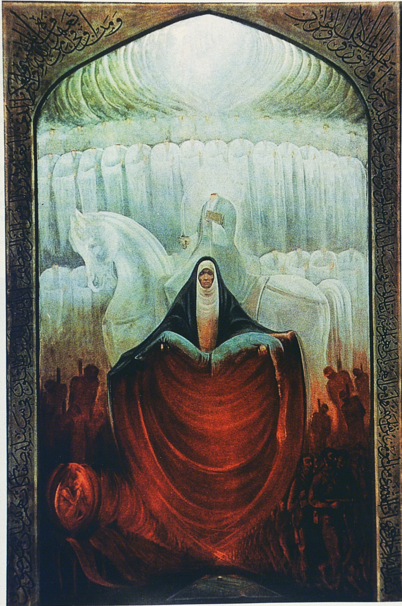
Fig. 30. « Le dévoilement » de Kâzem Tchali-pâ. Iran.