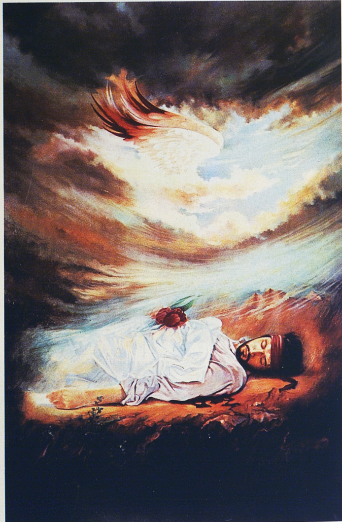
Fig. 29. « L'Ascension » de Mustafâ Godarzî. Iran. Coll. Éric Butel. Cl. Jean-Claude Fernandes.