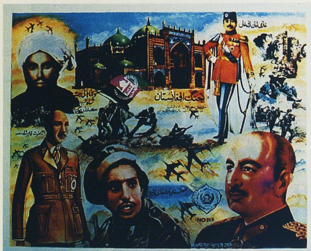
Fig. 31. Image composite montrant la mosquée de Mazar-i Sharif, les rois Amanullah et Zaher Shah, le président Daoud, le commandant Massoud, le martyr mawlana Hay Bet Khan, ainsi qu'une reproduction de la photographie représentant les marines américains plantant le drapeau - ici le drapeau afghan - sur l'île d'Iwo Jima (1945). Dimensions : 35,5 x 27,7 cm. Imprimé au Pakistan, acquis 1986. Coll. Pierre et Micheline Centlivres.