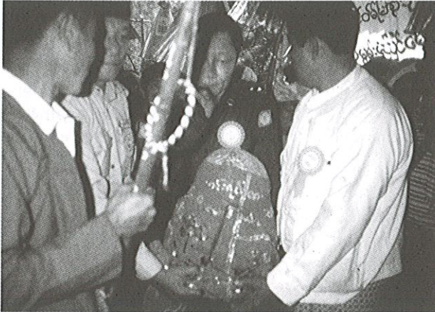
Fig. 2. Transport par un membre de la junte de l'une des quatre images du karaweik vers un hall d'accueil (Inlé, 1994)

Vice-Chairman of the State Law and Order Restoration Council Deputy Commander-in-Chief of Defence Services Commander-in-Chief (Army) General Maung Aye, accompanied by Secretary-1 of the State Law and Order Restoration Council Lt-Gen Khin Nyunt [...], ministers, senior Tatmadaw officers, local populace and pilgrims throughout the nation paid homage to the Buddha images being conveyed on board the float back to the pagoda [...]