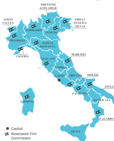
Figure 12: localisation des commissions locales du film en Italie

Aujourd'hui l'association comprend 18 commissions du film italiennes 2 . Cependant, cette liste ne