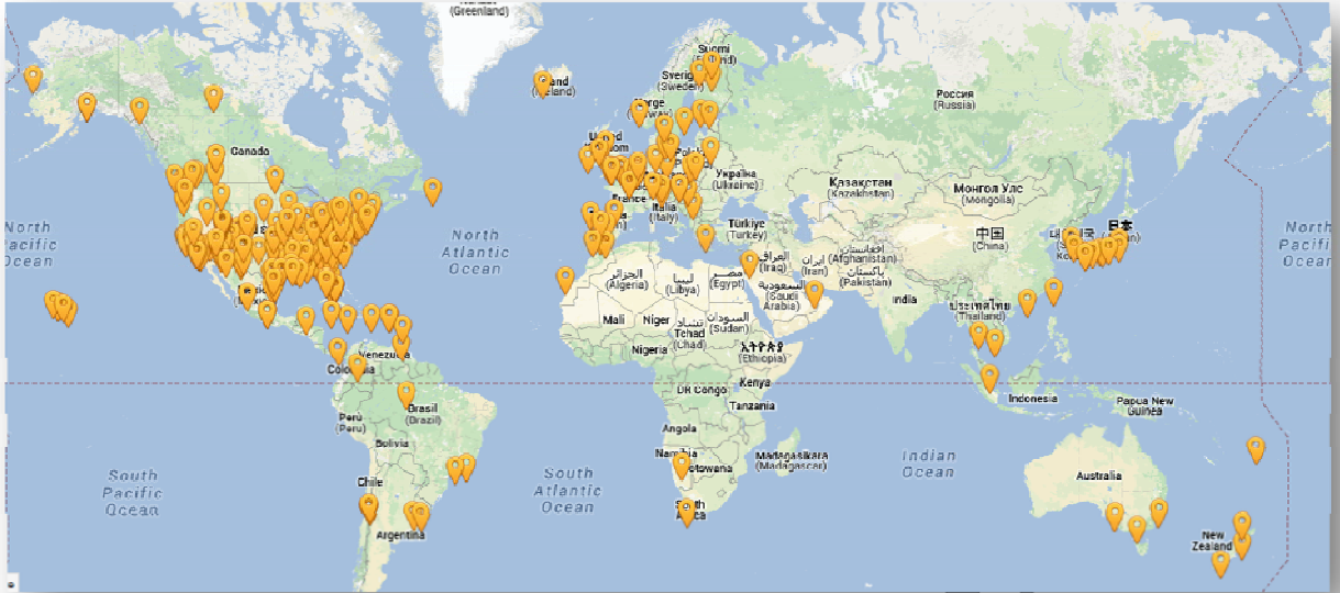
Figure 1: localisation des Commissions du film adhérentes au réseau international AFCI