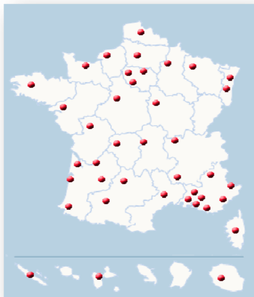
Figure 11: localisation des 41 commissions locales du film en France

Les bureaux d'accueil de tournages s'engagent à respecter la confidentialité des informations fournies par les équipes de production.