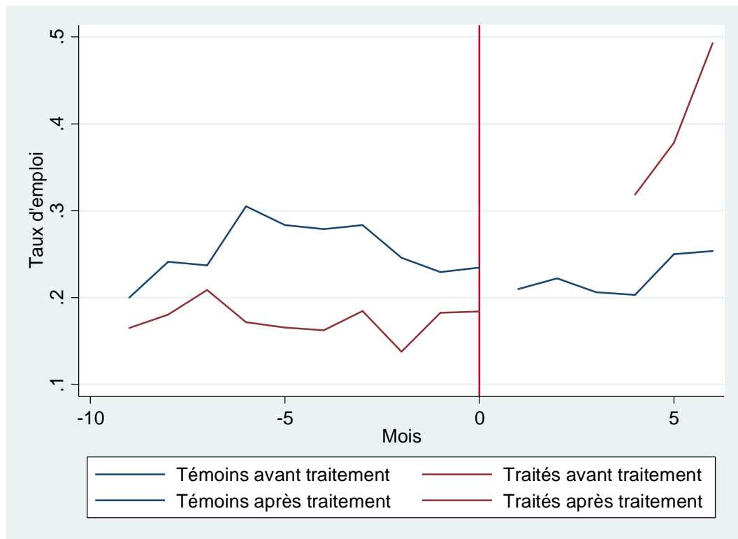
Graphique 2 : Evolution du taux d'emploi pour les individus du groupe traité et du groupe témoin qui sont présents sur les deux périodes

Il est toujours préférable d'utiliser la dimension longitudinale des données pour mieux contrôler de l'hétérogénéité individuelle, en utilisant des données répétées pour chaque individu. Les effets moyens au niveau des groupes sont remplacés par des effets fixes individuels :