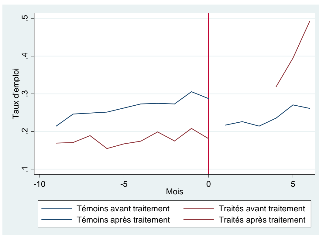
Graphique 1 : Evolution du taux d'emploi pour le groupe témoin et le groupe traité.

Sur ce graphique, on constate par ailleurs une baisse du taux d'emploi des jeunes non incorporés, six mois après la première interrogation. Cela peut s'expliquer par une attrition sélective du groupe de contrôle en seconde période. Si on se limite aux jeunes non incorporés qui ont répondu à la fois au premier et au deuxième questionnaire, la différence de taux d'emploi avec les jeunes incorporés est fortement réduite (graphique 2). On peut remarquer que les évolutions du taux d'emploi du groupe traité et du groupe témoin avant traitement restent similaires.