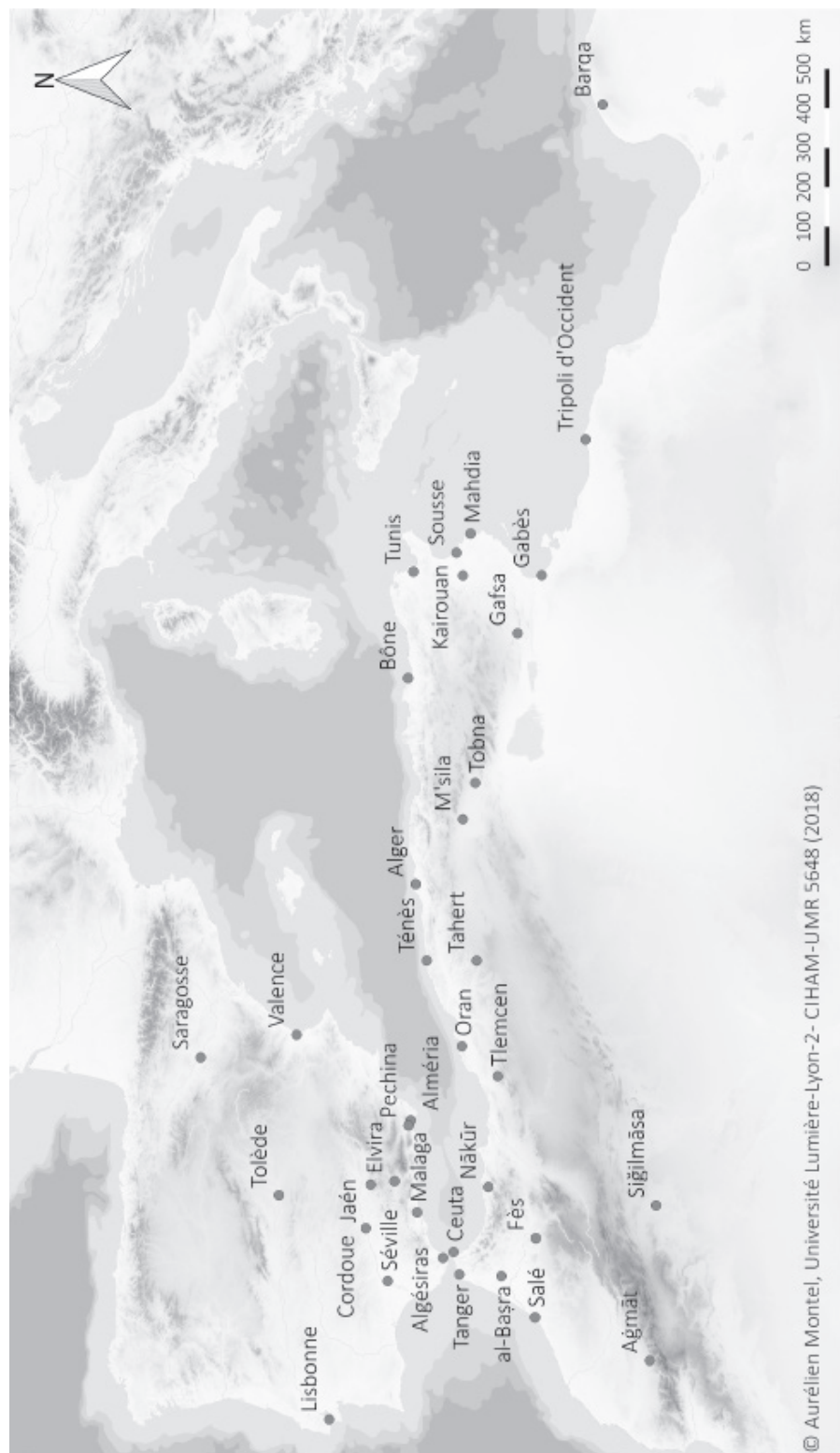
Fig. 1. L'Occident musulman (IX e -XI e siècles).