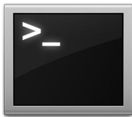
Figure 1 : Icône du programme « Terminal 8 » pour Ubuntu

L'icône du programme « Terminal » de la distribution GNU/Linux Ubuntu (figure 1) rassemble toutes les caractéristiques de cette image du texte. Le terminal y est réduit à sa plus simple expression : le fond noir, le texte en blanc 7 , la police dépouillée (monospace) le prompt (le symbole après lequel on est invité à taper une commande dans l'interpréteur) est représenté par le symbole « > » et le curseur par un « _ ». La fonction d'icône métonymique montre bien que la ligne de commande en tant que signe se résume à cela. Il suffit d'avoir ces éléments pour conclure : c'est une opération informatique compliquée.