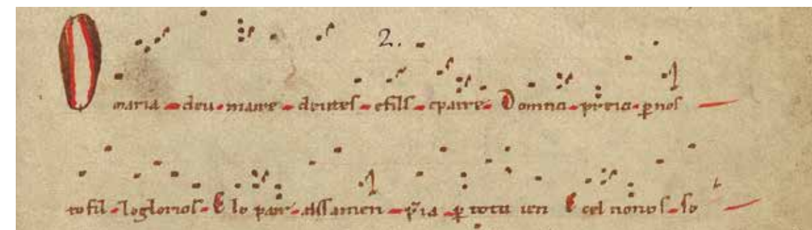
O maria deu maire , Paris BnF ms latin 1139, f. 4r, détail.

Les offices votifs de la Vierge (XIII e ) et les proses ou offices des Joies de la Vierge (XII e ) qui complètent la fin du volume suggère aussi une forte dévotion mariale, dévotion en plein essor à cette époque comme le montrent bon nombre de pièces en latin ou en langues vernaculaires. ■