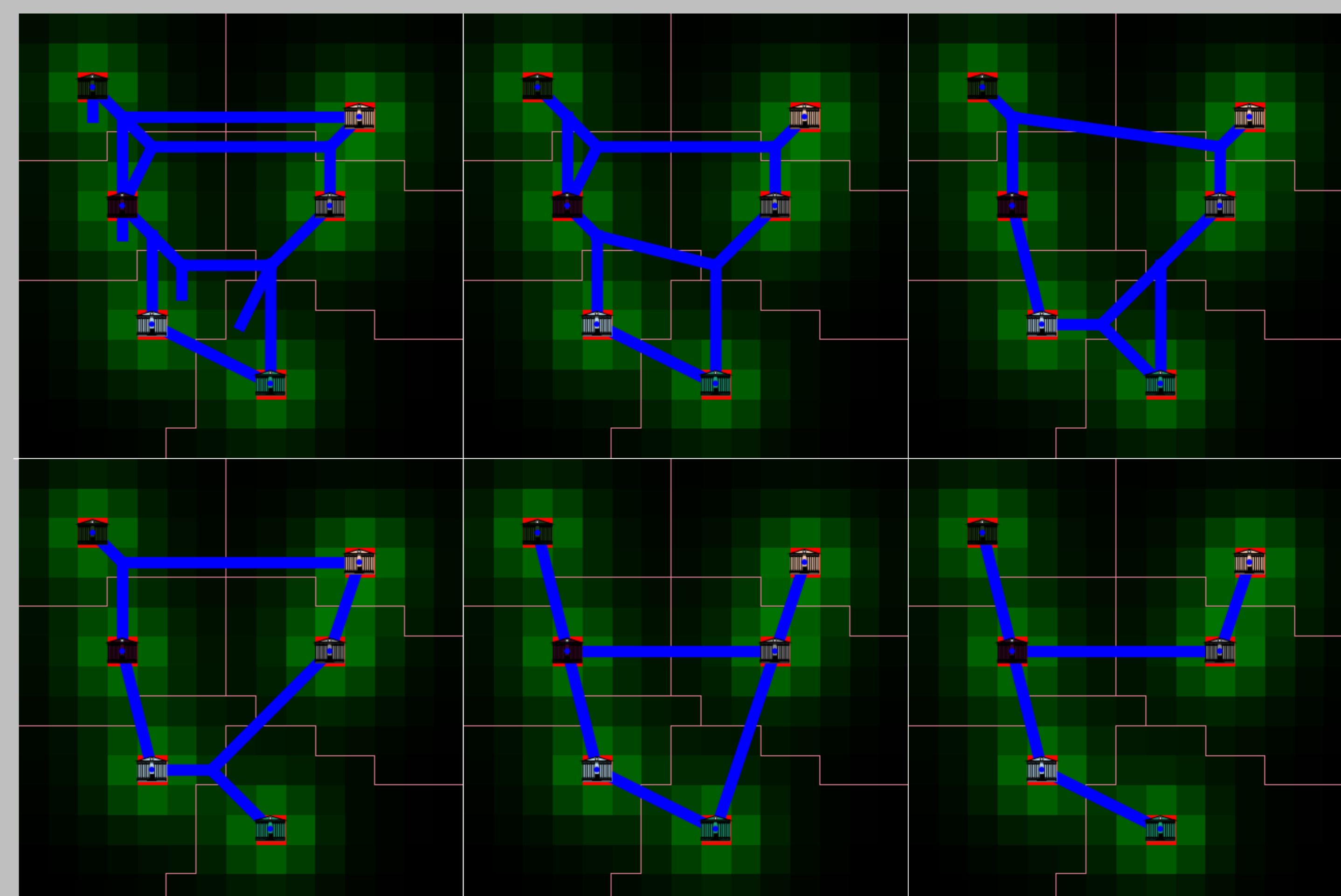
Réseaux stylisés obtenus pour des valeurs décroissantes de \gamma , pour une même configuration des centres de population à desservir (densité de population générée par mélange d'exponentielles).

Dans le cadre d'une configuration métropolitaine polycentrique stylisée [Le Néchet and Raimbault, 2015], comment élaborer automatiquement différents scénarios pour un nouveau réseau de transport ?