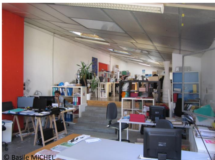
Figures 2 et 3 : Intérieur de deux espaces de coworking du quartier des Olivettes