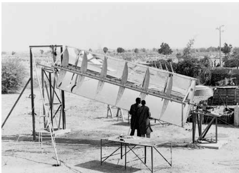
Un récepteur solaire cylindro-parabolique mis au point par Abdou Moumouni, photographie de 1970.