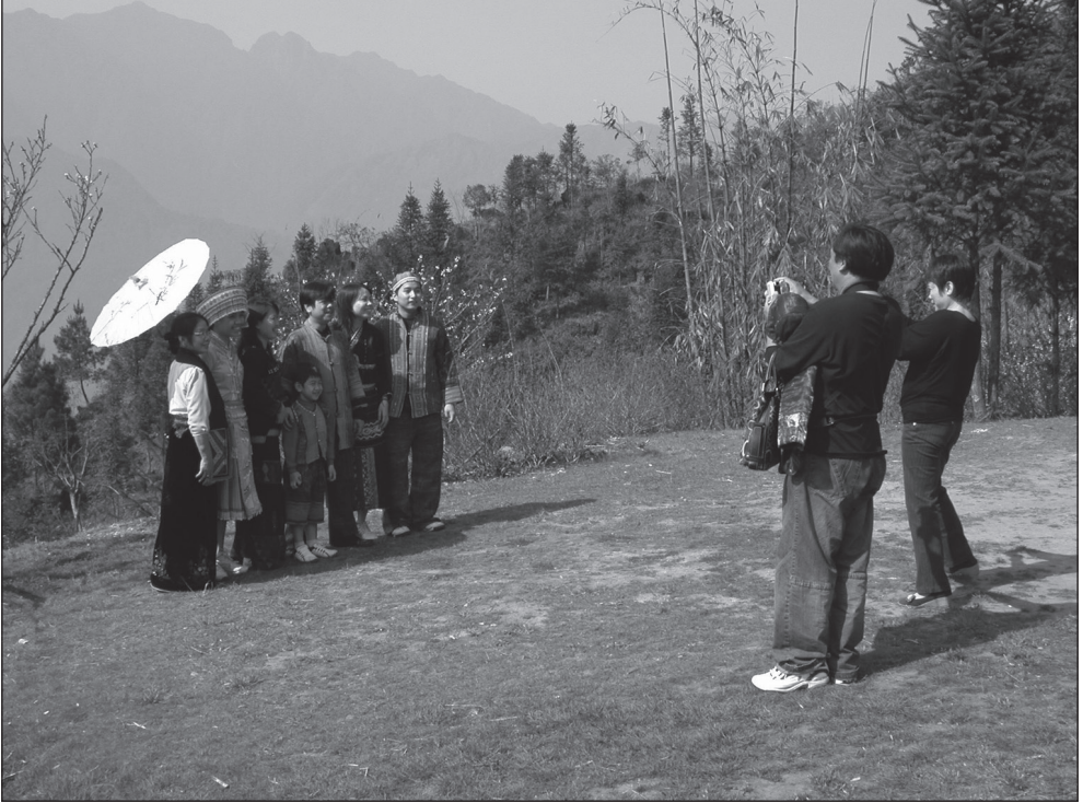
Planche 1. Touristes kinh se déguisant en « minorités ethniques », Sa Pa (Vietnam)