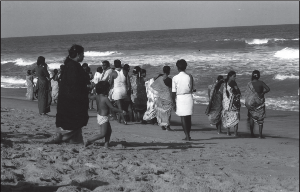
Planche 2. Touristes indiens découvrant la mer sur la plage de Mahaballipuram (Tamilnadu)