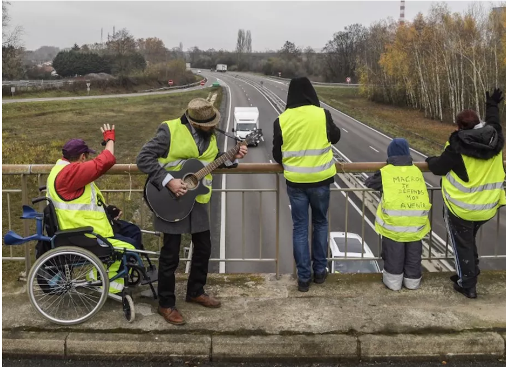
Sur un pont surplombant la N70, près de Montceau-les-Mines (dans le centre de la France), le 21 novembre 2018.