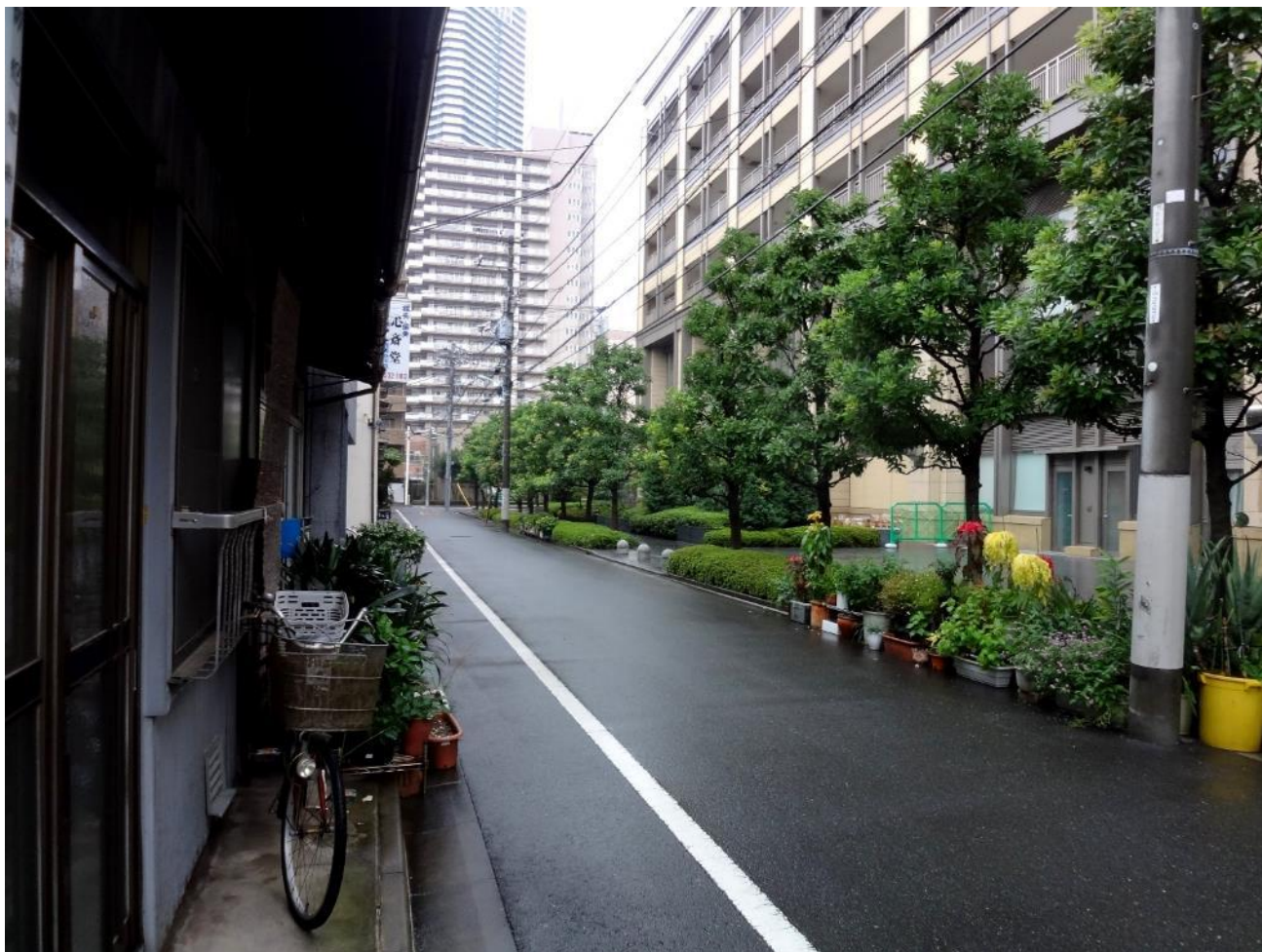
Fig. 5 : Privatisation de la voirie par des parterres de plantes et fabrication d'un trottoir sur l'espace privé d'un bâtiment (droite) dans l'arrondissement de Chūō (Tôkyô)

privatisent en partie, en l'utilisant illégalement pour disposer des parterres de plantes, dans la surveillance des accès, et même parfois en s'appropriant une partie de la rue pour des activités commerciales.