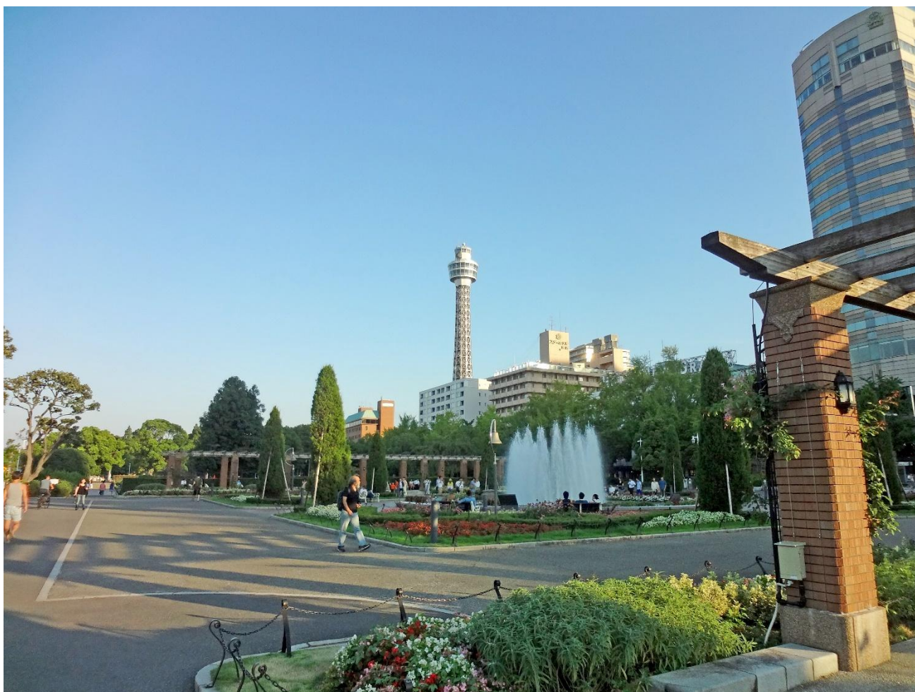
Fig. 3 : Le parc Yamashita à Yokohama

Ces aménagements sont complétés par les premiers parcs et jardins publics, comme celui d'Ueno, mais aussi ceux implantés dans les quartiers réservés aux étrangers, à Kannai (Yokohama) ou Kawaguchi (Ôsaka). On vient y observer et s'accoutumer aux pratiques et aux normes en vigueur dans les espaces publics européens. Par la suite, le parc Yamashita, 7,4 ha à Yokohama, construit avec les déblais du séisme de 1923, est une des premières promenades de front de mer au Japon. Japonais et résidents de la communauté étrangère, nombreux dans la ville, se mêlent, autour du décor urbain qu'est le port.