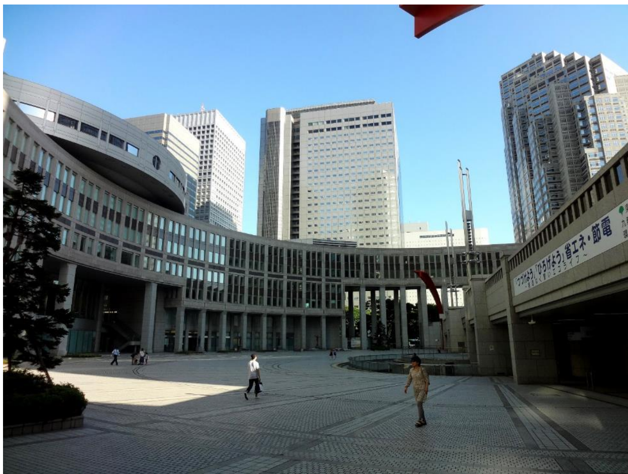
Fig. 6 : Le parvis des citoyens de la mairie centrale de Tôkyô à Shinjuku

La tertiarisation et l'internationalisation de l'économie et des villes japonaises dans les années 1990 a généré un besoin de transformation esthétique et qualitative des quartiers centraux. Sur des modèles popularisés dans les années 1970, avec une visée de plus grande attention aux habitants, les municipalités ont initié des projets de construction d'espaces publics et citoyens. Une des réalisations les plus exemplaires est certainement le « Parvis des citoyens » ( tomin hiroba ), aménagé au cœur des bâtiments de la mairie de Tôkyô, reconstruit en 1991 à Shinjuku. L'architecte de la ville, TANGE Kenzô, a ainsi doté les nouveaux bâtiments d'une place centrale sensée jouer le rôle de forum, où les citoyens de la ville devaient se rencontrer. Mais depuis son ouverture, ce parvis reste désespérément vide de public et encore plus de citoyens. Cet échec conforte la difficulté, qui n'est pas spécifique à Tôkyô, de concevoir des espaces publics et citoyens planifiés comme tel en amont. Dans le même temps, la mairie de Tôkyô évacuait un couloir dans l'espace public de la gare de Shinjuku où se concentraient des SDF et leurs soutiens. Ceux-ci étaient engagés dans une action de revendication citoyenne de droit à la ville et à leur présence dans l'espace public, interpellant les usagers de la gare et portant le débat public dans cet espace.