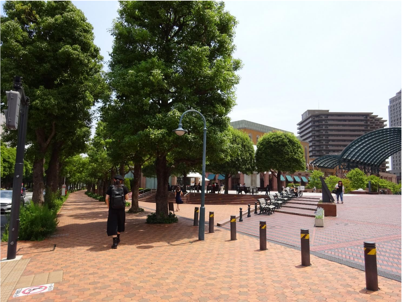
Fig. 7 : Trottoir et bancs publics privés du Ebisu Garden Place (photo : R. Scoccimarro 2018)

En revanche les règlements sont drastiques et au final seule la déambulation et l'arrêt sur les bancs sont autorisés. La confusion entre espace public et privé, pas forcément évidente par exemple sur le Garden Place d'Ebisu, pose question. Pour autant qu'ils soient ouverts au public gratuitement, qu'ils répondent aussi à une demande d'espaces agréables de flânerie, finalement, à l'instar de l'utilisateur de services gratuits en ligne, le public est surtout une matière première pour ces espaces. Il contribue à la notoriété des lieux et donc à la production de valeurs foncières. Le public, discipliné et surveillé par des vigiles et des caméras, participe aussi au paysage et donc à la production de valeurs esthétiques. Enfin, en tant que consommateurs des enseignes installées dans ces espaces, le public participe aussi à leur valeur commerciale.