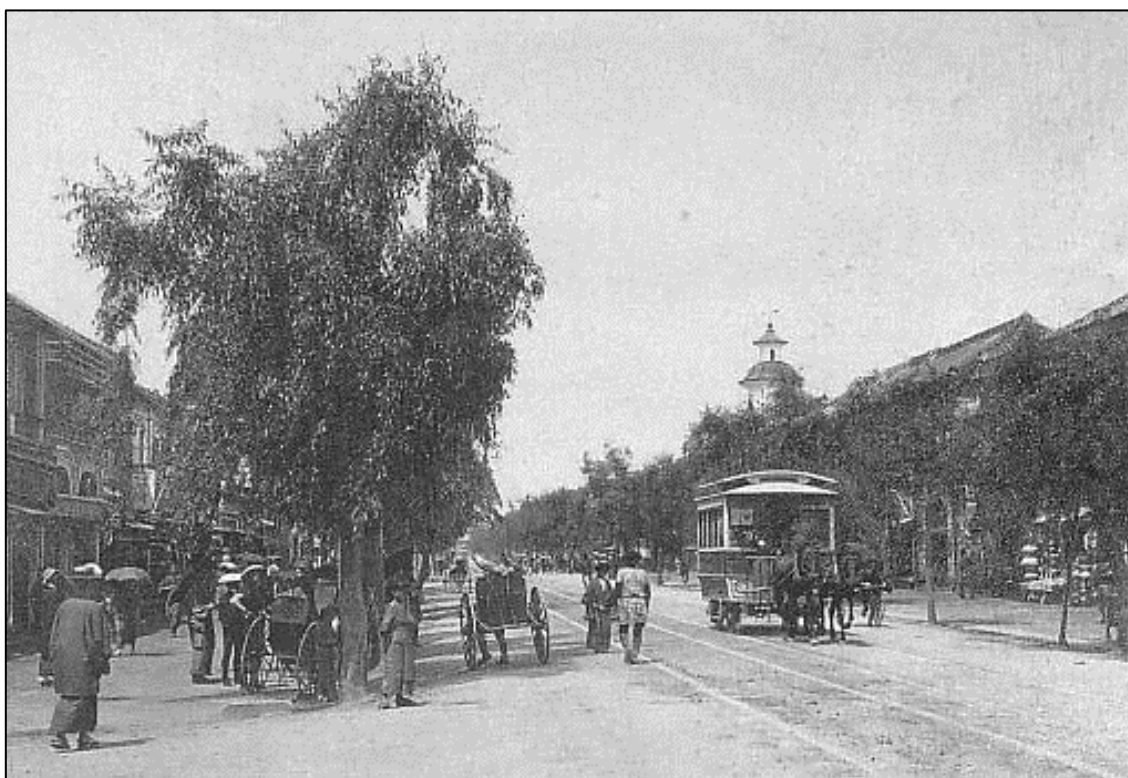
Fig 2. Ginza en 1880

Dans le même temps, on perce les premières avenues autour de la gare centrale de Tôkyô, dont l’avenue Ginza. Elles sont dotées de trottoirs qui constituent les premières formes d’espaces publics réservés à la seule déambulation.