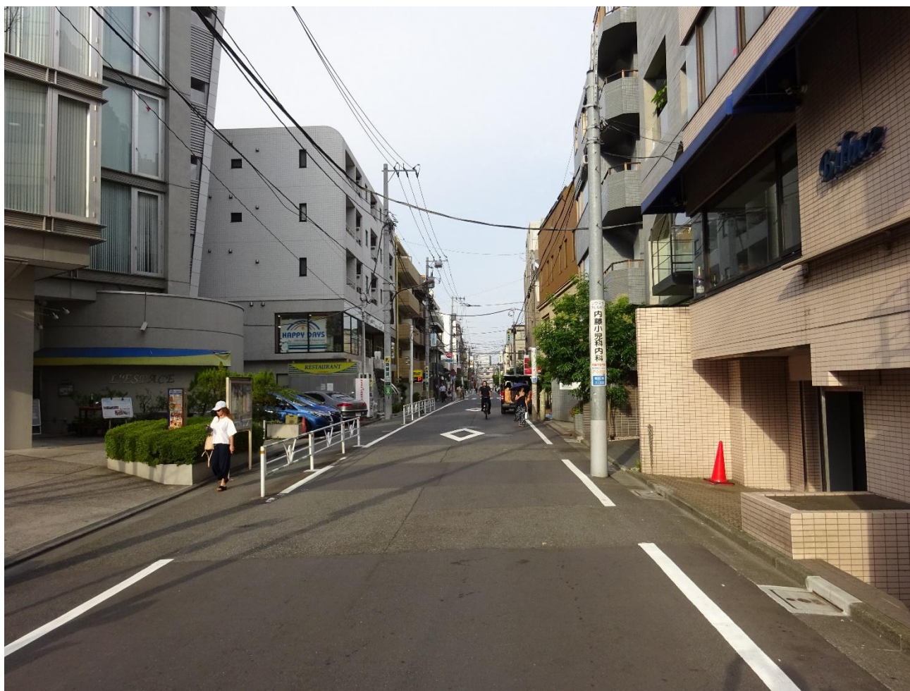
Fig. 4 : Rue sans trottoir dans l'arrondissement de Shibuya (Tôkyô)

Malgré la modernisation de la ville, le tissu urbain a conservé sa structure originale : seules les grandes avenues sont ainsi équipées de trottoirs. Les rues internes ne sont dédiées qu'à la circulation et il n'y a pas d'espace spécifique entre l'emprise au sol du privé et la voirie publique. Ainsi, pour imposer l'aménagement d'espaces de déambulation, les règles d'urbanisme imposent progressivement une emprise au sol de 80% au maximum pour les nouvelles constructions. Cela force la création de zones ouvertes sur la rue et d'accès public. Ce sont essentiellement les bâtiments collectifs qui sont concernés, plus que les propriétés individuelles. Mais cela permet de libérer de l'espace ouvert. Ceux-ci sont d'accès public et se fondent dans la voirie, tout en restant sous contrôle privé, et sont souvent réglementés. Ils constituent des espaces dédiés à la déambulation et bénéficient souvent d'une attention particulière de la part des propriétaires, dans une logique de notoriété.