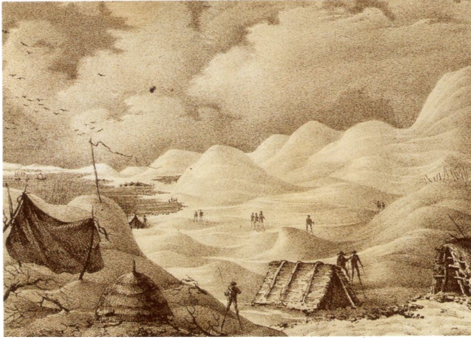
Ill. 1 - Légé d'après Arago, Dunes de sable à La Teste (1 ère moitié du XIX e siècle). Montagnes mouvantes de sable, landais perché sur leurs échasses... Les dunes et leur petit peuple étrange fascinent autant qu'elles inquiètent.

Tout en sacrifiant à l'emphase catastrophiste, on s'efforce de prendre la juste mesure du désastre. En 1810, Jean Thore estime que « [l'] avancement [des dunes] est d'environ 20 mètres par an, d'où on peut conclure que tous les villages qui ne sont qu'à 200 mètres des dunes seront ensevelis sous les sables si on ne se hâte pas d'arrêter leur marche envahissante ». Au tournant des XVIII e et XIX e siècles, la multiplication des discours alarmistes est indissociable de l'apparition des premiers grands projets de fixation des dunes, conçus comme un préalable à la mise en valeur du pays. En 1788, l'ingénieur Nicolas Brémontier — que la mémoire nationale retiendra comme « celui qui fixa les dunes et les couvrit de forêts » 3 — dans une prédication aux allures de sermon millénariste prévoit que « le riche territoire des environs de Bordeaux [sera] un jour couvert de trois ou quatre cens pieds de sable » 4 .