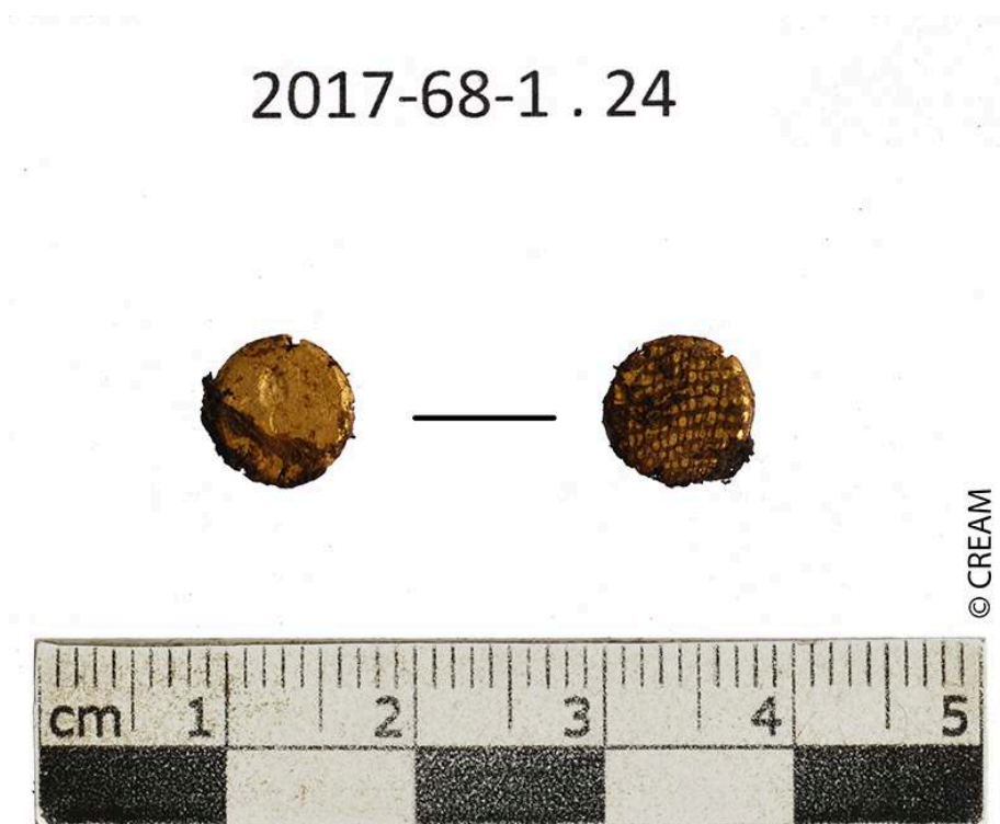
Fig. 9 – Trésor, piécette d'or