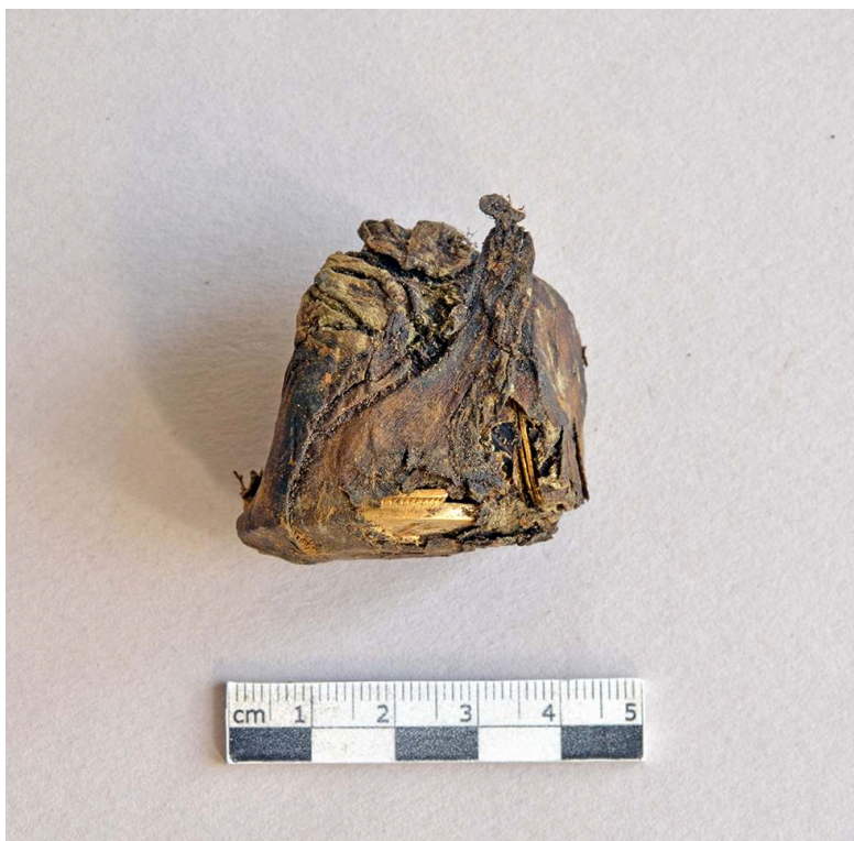
Fig. 3 – Bourse en peau avant son ouverture