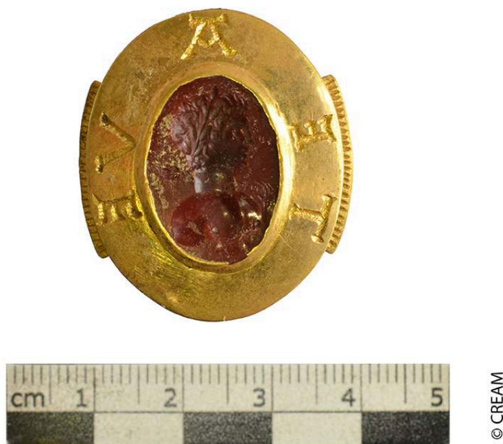
Fig. 8 – Trésor, bague sigillaire