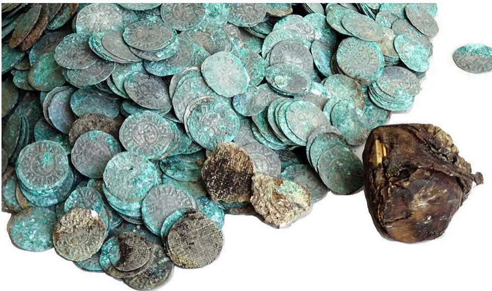
Fig. 5 – Trésor, deniers clunisiens en argent et la bourse en peau