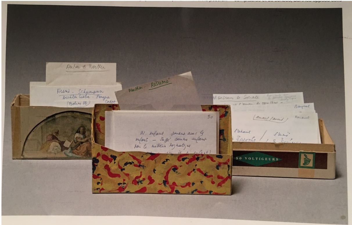
Figure 4 Le Fichier Barthésien

produit des « constellations » 19 sémantiques à partir d'un texte. Ce déplacement est évident lorsque le « second Barthes » affirme en 1975 que l'analyse textuelle « préfère la métaphore du réseau, de l'intertexte, d'un champ surdéterminé, pluriel » « à la métaphore de la filiation, du "développement" organique » 20 . Ces réseaux intertextuels sont comme la contrepartie littéraire du Web en train de s'inventer, héritage clairement analysé par George Landow dans son essai de 1991 Hypertext. The Convergence of Contemporary Critical Theory and Technology (réédité sous le titre Hypertext 2.0 ) : l'idée barthésienne d'un texte sans centre ni limite car extensible à l'infini 21 (« tout texte est un intertexte » 22 ) joue un rôle séminal dans la conception émergente d'un hypertexte numérique, où la navigation ne se fait pas d'idée en idée mais simplement de mot en mot.