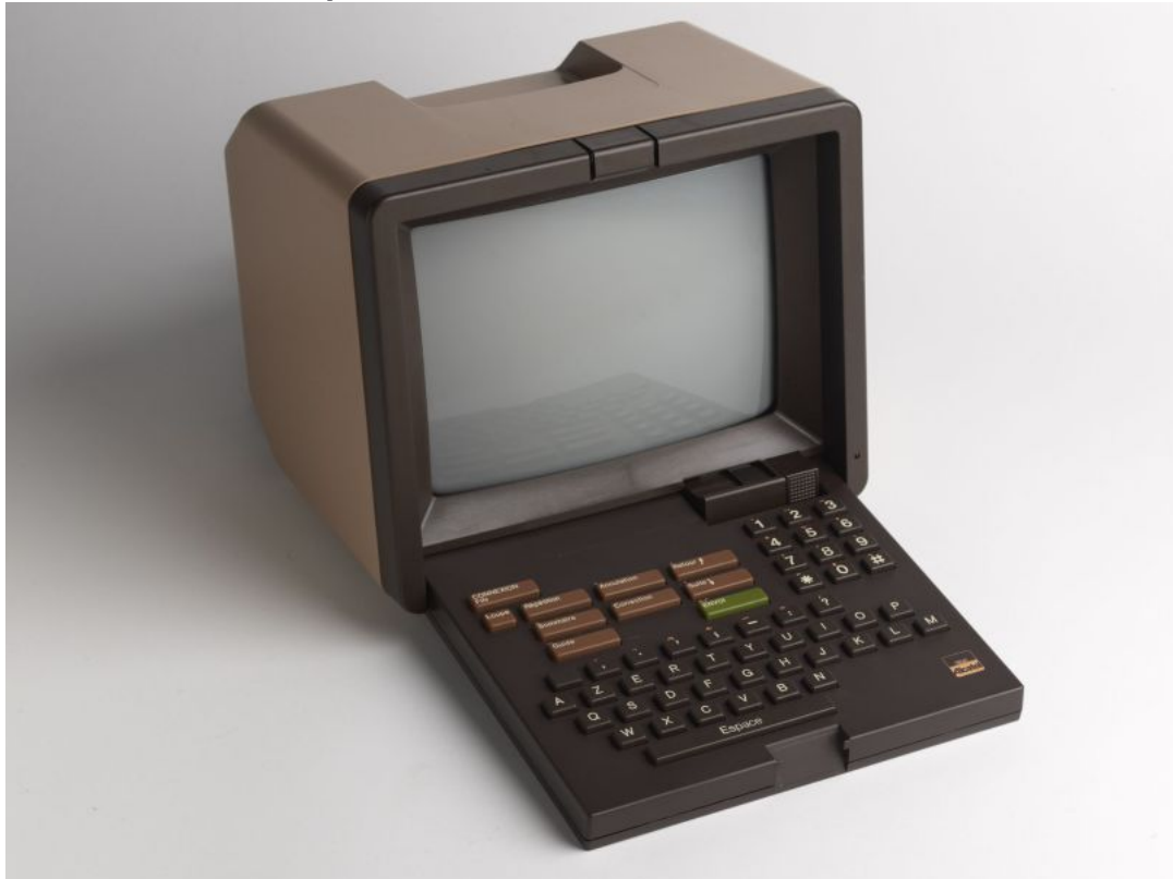
Figure 1 Le Minitel, ancêtre du Web

L'œuvre théorique de Barthes s'élabore dans la décennie même où s'invente le Web (1969 : première connexion d'ordinateurs en réseau-1979 : création des premiers