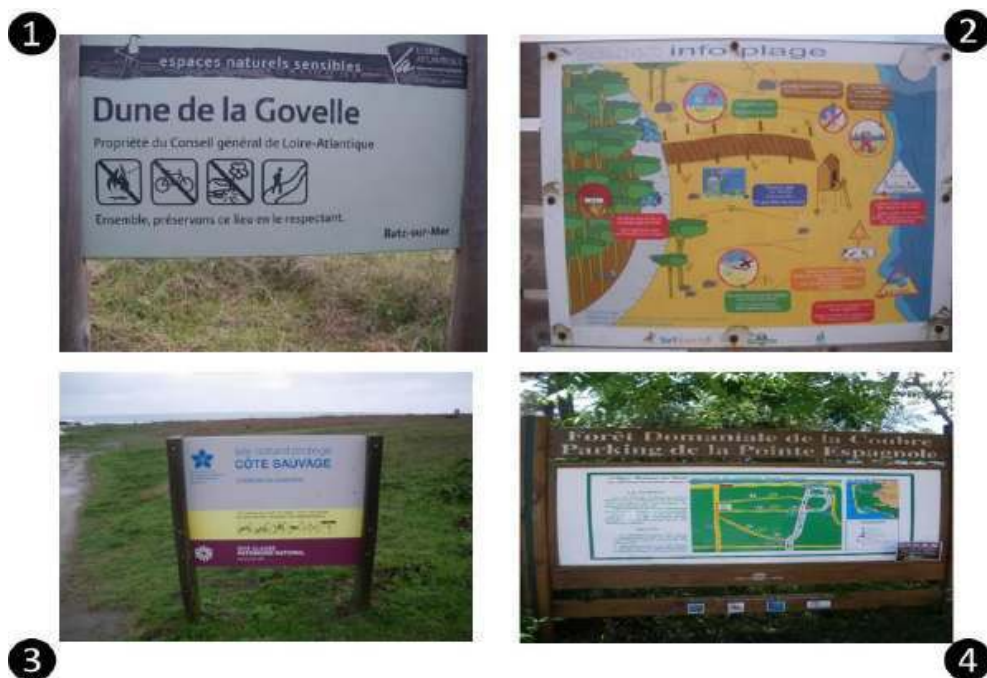
Figure 3. Sensibilisation des visiteurs à la préservation dans la pratique de la côte