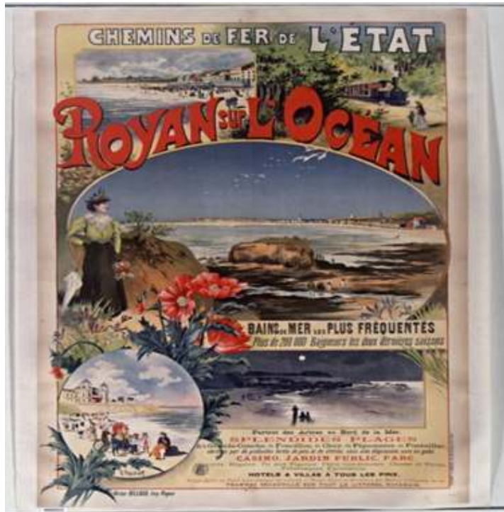
Figure 1. Affiche des chemins de fer de l'État, Royan sur l'Océan : des bains de mer les plus fréquentés.