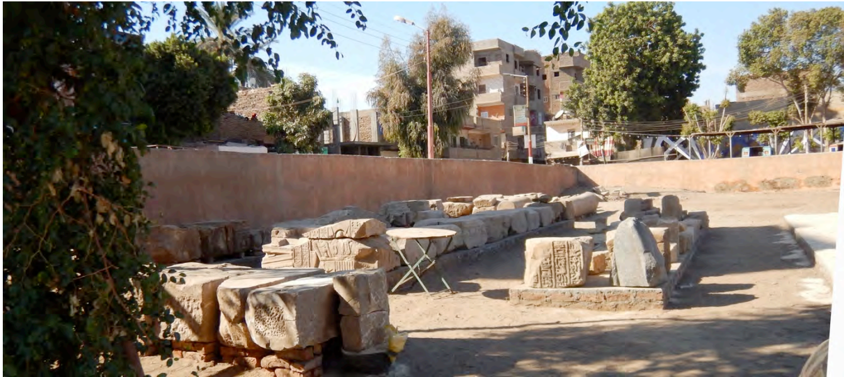
Fig. 14. Les banquettes installées au nord de l'entrée du site.