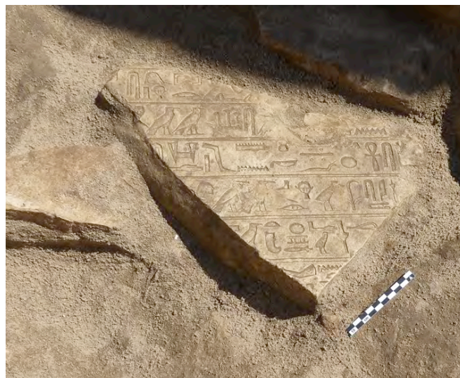
Fig. 11. Fragment d'une stèle de la XI e dynastie remployé dans le sable de fondation du déambulatoire E, section nord.