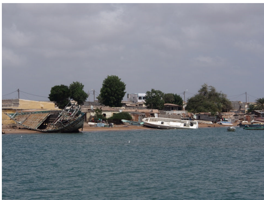
Sur la plage d'Obock, de nombreuses embarcations, boutres ou bateaux de pêche, sont « échouées » ou retournées, en attente d'être réparées (mars 2016).

auprès des pêcheurs pour lesquels l'absence de revenus fixes rendait les taux d'intérêt très élevés. D'autres instances de crédit comme la Caisse populaire d'Épargne et de Crédit (CPEC) auraient tenté de mettre en place des prêts mais la difficulté était la même : « Ce n'est pas normal, déclarent les pêcheurs, que des systèmes de crédits populaires soient plus chers que les banques normales » 1 .