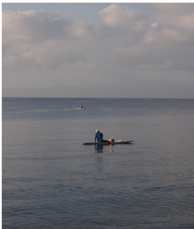
Pêcheurs sur planche à Tadjoura, vers 7 heures, du matin, février 2016.

n'étant pas membre d'un équipage. D'après ce même témoignage, les planches, plus stables, remplacent des bouées en forme de roue, utilisées autrefois. Les planches seraient un véritable avantage pour limiter les charges de carburant et, aussi, limiter la pêche à l'espadon. Ce poisson difficile à attraper ne se laisse en effet capturer qu'une fois essoufflé et fatigué et échappe donc aux pêcheurs solitaires qui meuvent leur planche avec une simple pagaie. Eux aussi pêchent avec de simples lignes qu'ils attachent au pied ou à la main.