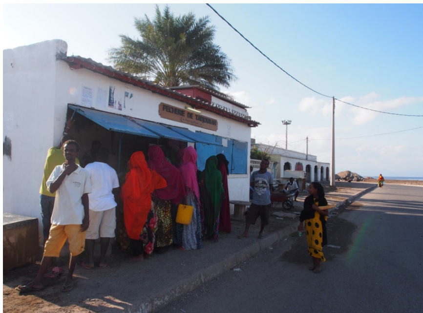
La pêcherie de Tadjoura à l'heure de la vente, à 10 h, février 2016.

l'inverse, à Tadjoura et à Obock, la vente de poisson se fait dans les pêcheries locales. Il s'agit le plus souvent d'un bâtiment appartenant aux coopératives de pêche. Les ventes sont un lieu important de rencontres entre acheteuses 1 et coupeurs / pêcheurs. Les prix sont généralement fixés par accord entre les deux, selon les arrivages de poissons.