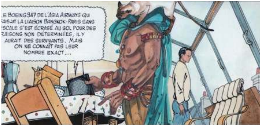
Fig. 10 : Carré & Michaud, Le Pays Miroir , tome II, p. 28.

insistant sur sa posture dans l'espace (avec son accoutrement significatif), des gros plans sur ses abdominaux d'athlète (figure 10) :