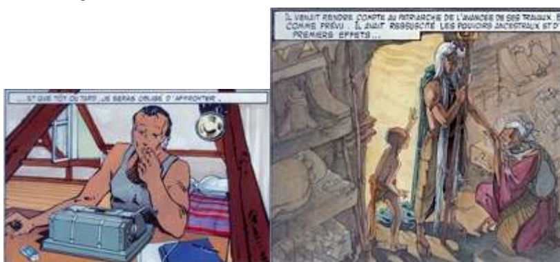
Fig. 6 et 7 : Carré & Michaud, Le Pays Miroir , tome I, p. 34. © Dargaud - Tous droits réservés