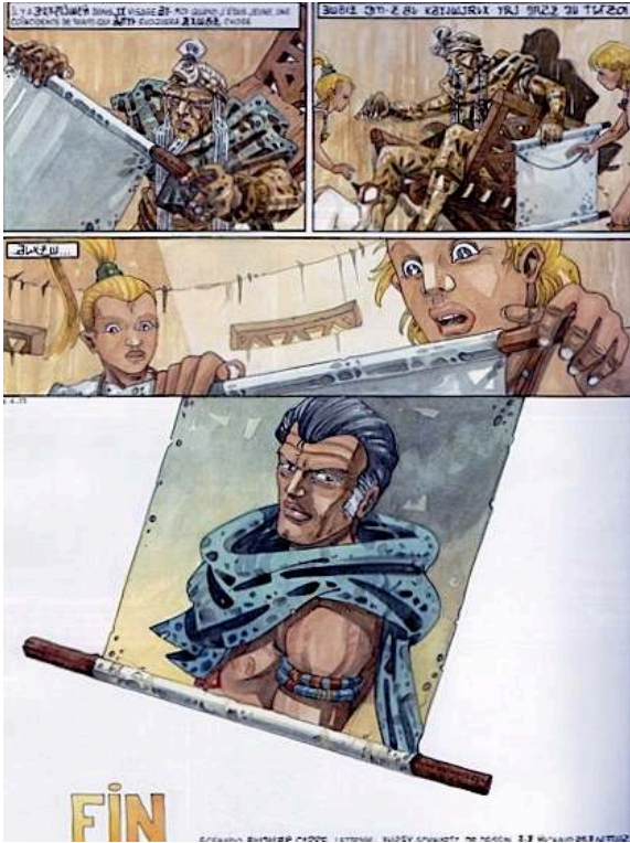
Fig. 15 : Carré & Michaud, Le Pays Miroir , tome III, p. 54.