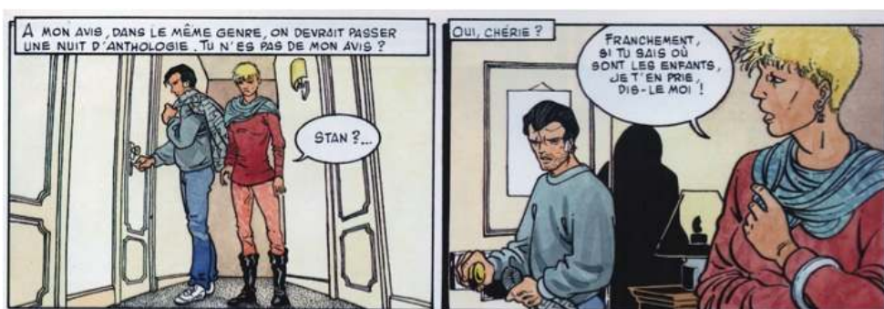
Fig. 3 : Carré & Michaud, Le Pays Miroir , tome III, p. 27. © Dargaud - Tous droits réservés