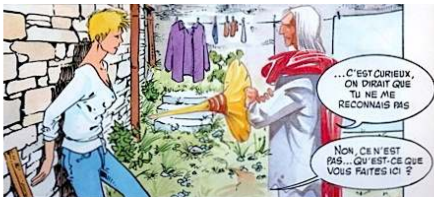
Fig. 2 : Carré & Michaud, Le Pays Miroir , tome I, p. 29 ©Dargaud - Droits réservés

convaincre, non seulement du contraire, mais aussi de s'auto-détruire. Le couple de Stan et Rebecca s'effondre ; des morts surviennent (par centaines, dont la soeur de Rebecca) ; à la fin du second tome, leurs deux enfants sont enlevés par les Héliones. Le récit de ce combat métaeptique choisit donc un mode dramatique, voire tragique — ce qui vient faire contre-exemple à l'évaluation proposée par Ryan. Le troisième tome conclut l'aventure en tressant : tout d'abord une enquête de police et la disparition de Stan et Rebecca, et donc de leur monde (le nôtre) ; puis, dans celui des Héliones, la réélection de Meldeg le Mage au très ennuyeux (et très masculin) Conseil des Sages, l'adoption des enfants enlevés par la communauté, et l'arrivée d'une sorte d'hiver pétrifiant toute forme de vie, à laquelle ces derniers vont toutefois échapper en raison de ce que Meldeg désigne comme une "nature physique" différente. La trilogie se conclut sur une planche où le mage, le langage envahi par des runes ("langage de pierre", sans doute) a tout juste le temps de tendre aux enfants un portrait de lui en jeune homme, avant de se pétrifier (2 cases) ; le visage étonné des enfants penchés sur le portrait (1 case) ; et le portrait de Meldeg jeune lui-même (hors case), dont les traits sont — sans doute l'a-t-on deviné ? — ceux de Stan.