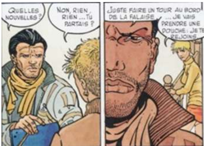
Fig. 12 : Carré & Michaud, Le Pays Miroir , tome III, p. 35. © Dargaud - Tous droits réservés