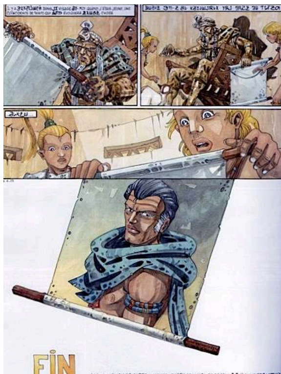
Fig. 15 : Carré & Michaud, Le Pays Miroir , tome III, p. 54. © Dargaud - Tous droits réservés