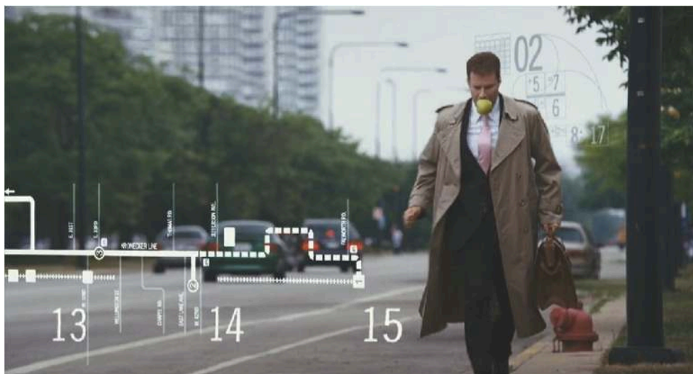
fig. 1: Forster, Stranger than Fiction , 2:01:14.