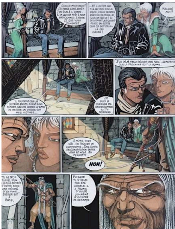
Fig. 11 : Carré & Michaud, Le Pays Miroir , tome II, p. 53. © Dargaud - Tous droits réservés