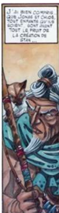
Fig. 14: tome III, p. 48.