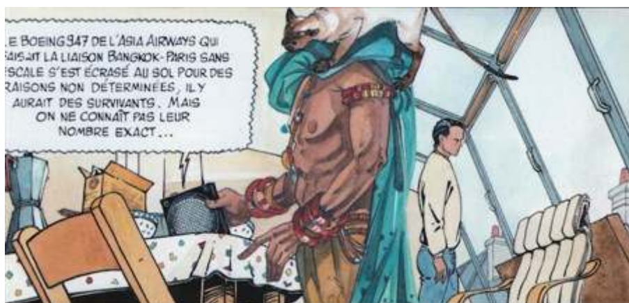
Fig. 10 : Carré & Michaud, Le Pays Miroir , tome II, p. 28. © Dargaud - Tous droits réservés

insistant sur sa posture dans l'espace (avec son accoutrement significatif), des gros plans sur ses abdominaux d'athlète (figure 10) :