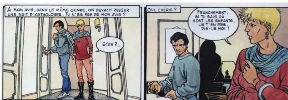
Fig. 3 : Carré & Michaud, Le Pays Miroir , tome III, p. 27. © Dargaud - Tous droits réservés