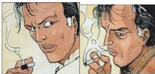
Fig. 8 et 9 : Carré & Michaud, Le Pays Miroir , tome II, p. 27 et 38. © Dargaud - Tous droits réservés