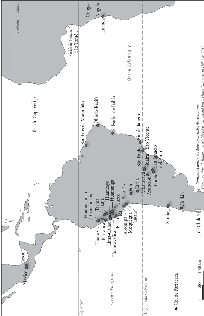
CARTE 2. — Amérique, Afrique occidentale et océan Atlantique.