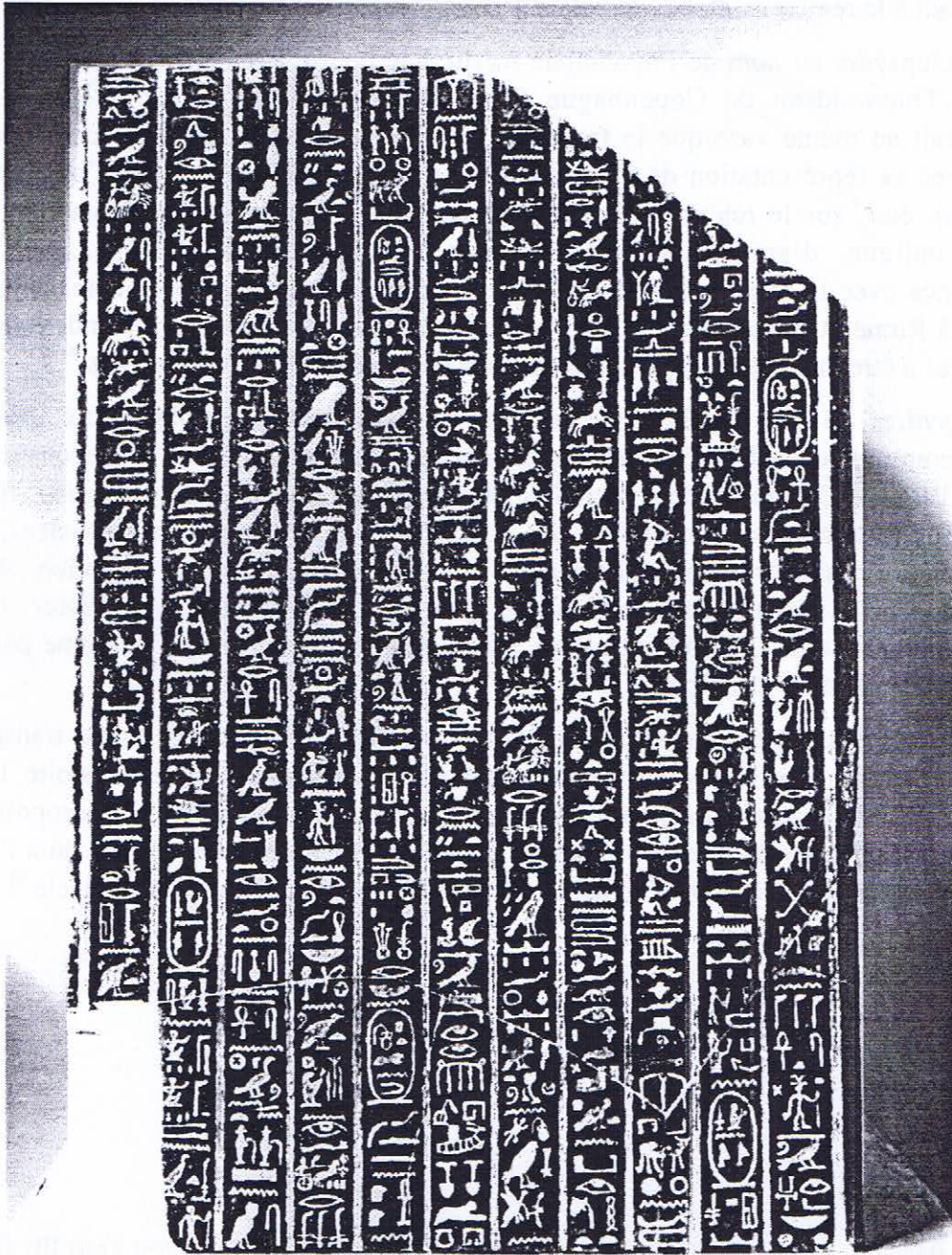
Fig. 1. Fragment Louvre C. 123. (© M. et P. Chuzeville, musée du Louvre).