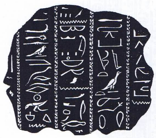
Figure 6 : C.C. MALVASIA, Marmora Felsinea... , Bologne, 1690, p. 33.