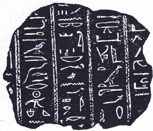
Fig. 5. L. LEGATI, Museo Cospiano... , Bologne, 1677, p. 166. (©Bibliothèque nationale de France, Paris).