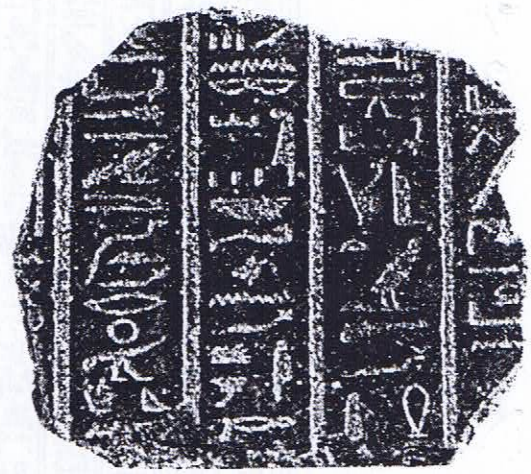
Figure 7 : Fragment Naples, inv. 1034